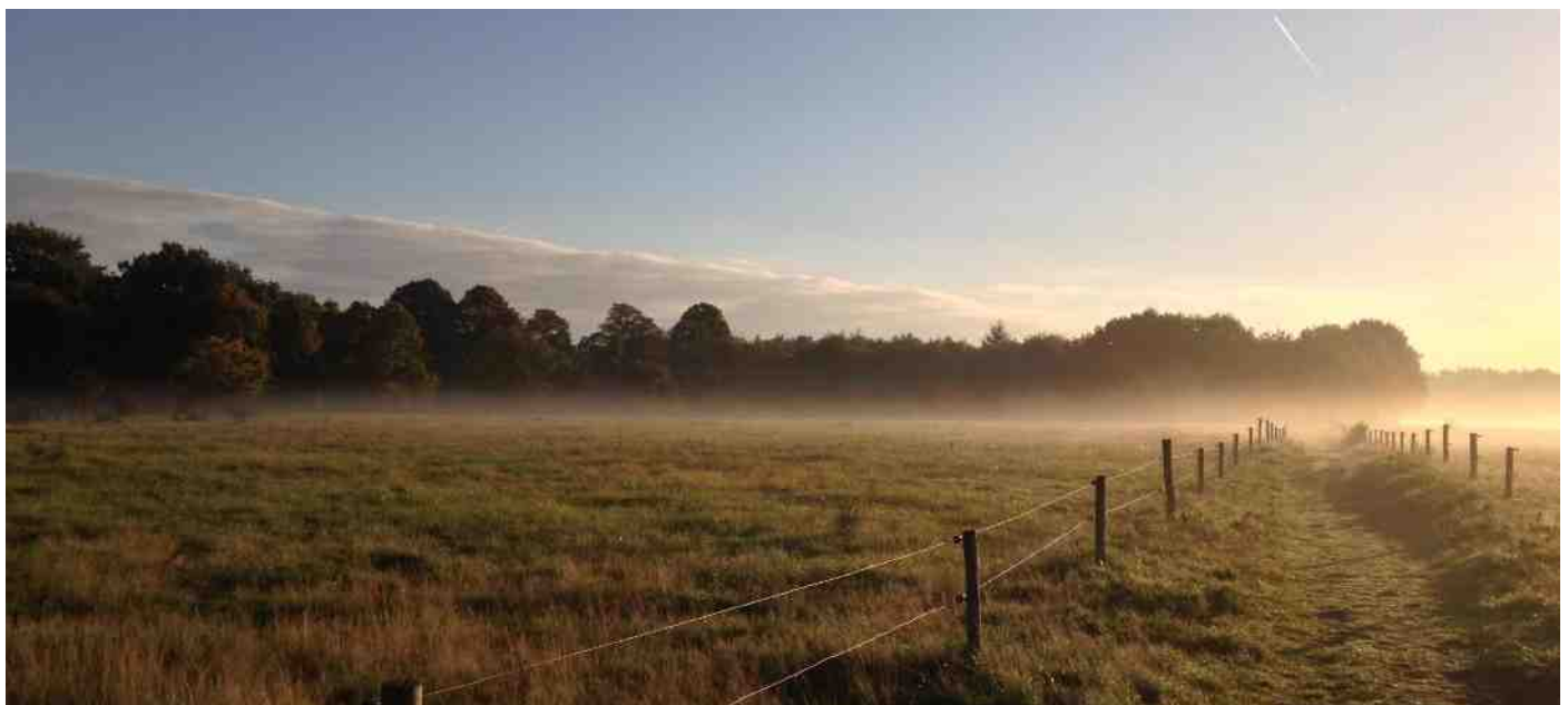
Swalmen, De Hout

Er is nog steeds een leuke, waardevolle en essentiële functie te vergeven, namelijk het secretariaat. Binnen het bestuur wordt gezocht naar een secretaris. Iets voor jou? Laat het horen, laat het weten aan bestuur@ivnroermond.nl. Bellen mag, mailen mag, vragen mag, eigenlijk mag dus alles en niet vergeten: ook suggesties zijn welkom. Het bestuur vergadert op jaarbasis 10x, roulerend bij iedereen thuis. Altijd erg inspirerend en ook nog gezellig!