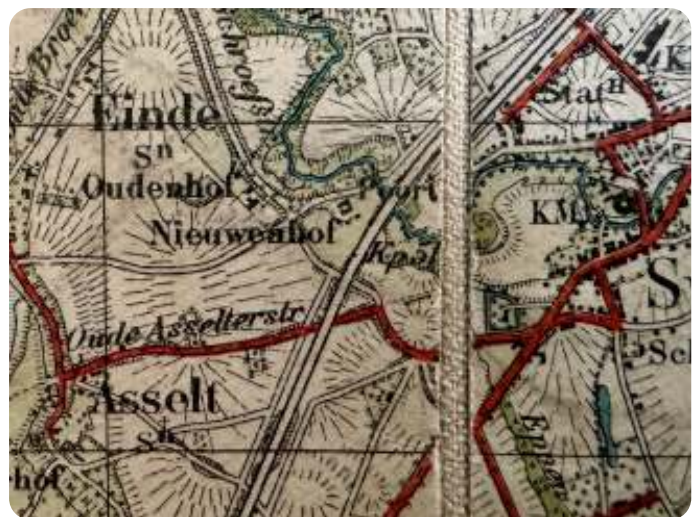
Oudenhof en Nieuwenhof op een topografische kaart uit 1931.