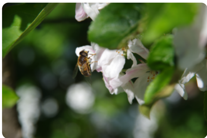
Kegelbijvlieg - Eristalis pertinax

Wilde hommels moeten eerst een kolonie opbouwen. De koninginnen beginnen in maart te vliegen, en de werkers vliegen door tot in oktober. Ook veel zweefvliegen hebben een lange periode van activiteit. Dit heeft gevolgen voor het voedselaanbod. Alleen aanbod van fruitbloesem is niet voldoende om te zorgen dat wilde bijen zich goed kunnen voortplanten of een volk kunnen opbouwen. Vooral de vroege periode, die voorafgaat aan de bloei van het fruit, heeft in de omgeving van de boomgaard vaak extra aandacht nodig, vooral omdat de keuze aan bloeiende kruiden en hagen dan minder groot is.