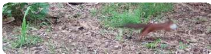
Gekiekt door de wildcamera: eekhoorn met ei