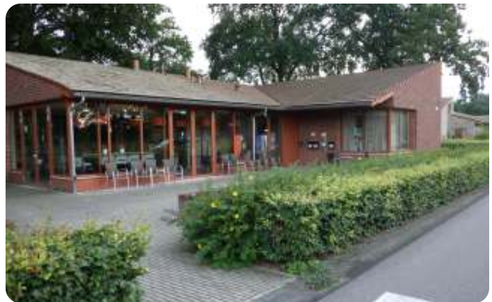
Theehuis bij Camillus open voor omwonenden, foto Huug Stam

Door mee te werken aan nieuwe ontwikkelingen, kan ik tegelijkertijd een vinger aan de pols houden.