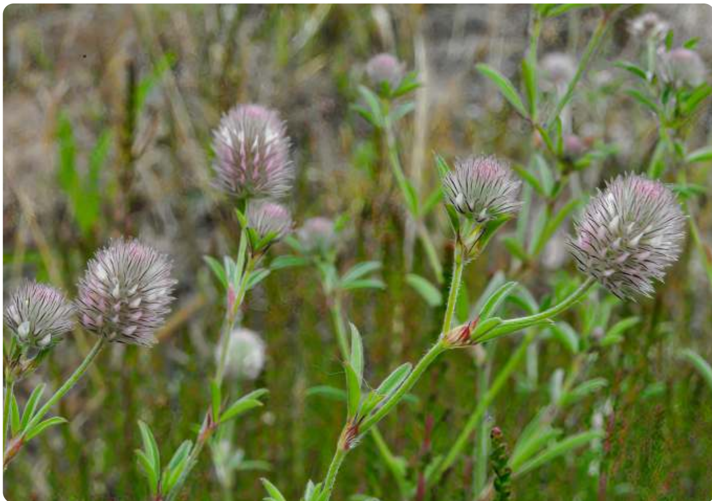
Zich ontwikkelende bloemhoofdjes van Hazenpootje

Hazenpootjes zijn pionierplanten van zonnige plekken met een lage en vrij open begroeiing. De bodem is zandig, lemig of stenig en grindig en matig voedselarm. De plant wordt aangetroffen langs de randen van akkers, schrale graslanden, zandduintjes, kalkgraslanden, wegbermen, heiden, spoorbermen, industrierterreinen, zandgroeven, en dergelijke. Daar groeit ze dan doorgaans samen met plantensoorten die enigszins vergelijkbare standplaatsen hebben, zoals biggenkruid, zandblauwtje, schapenzuring, rolklaver en vogelpootje, maar ook wel met minder algemene soorten als dwergviltkruid en viltganzerik. De soort komt van oorsprong voor in Europa, maar is inmiddels op veel plaatsen in de wereld ook ingeburgerd. Denk aan Australië, Nieuw Zeeland en Noord-Amerika. In Nederland wordt ze in het hele land aangetroffen, maar vooral in de duinen en de zandgebieden van Zuid- en