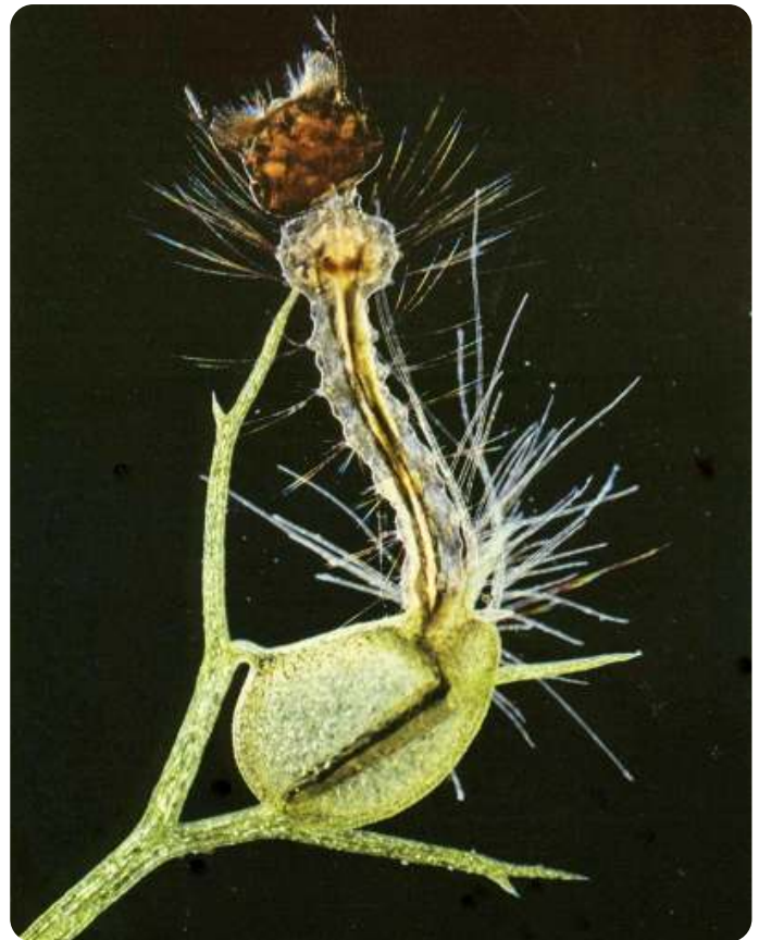
Enkele achterlijfsegmenten van een muggenlarve worden verteerd