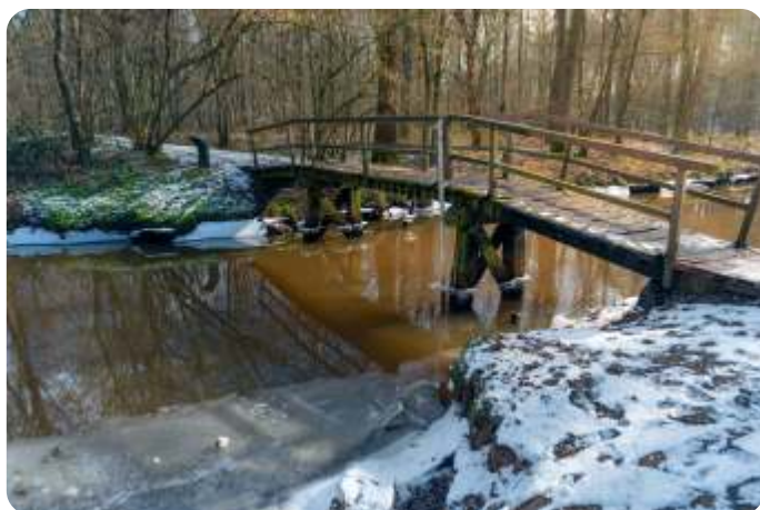
De Leubeek, kerstwandeling 2024

We sluiten de wandeling in kerstsfeer af; laat u verrassen.