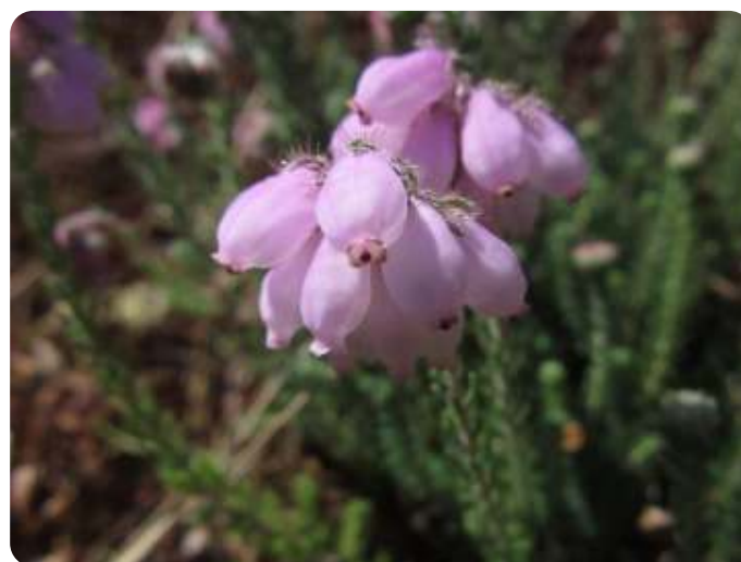
Dopheide.