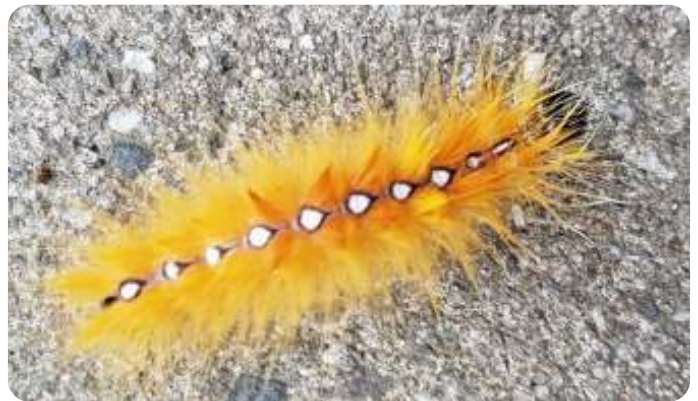
Rups van het bonte schaapje

De excursies, quiz, creatieve uitingen, het ontbijt, de lunch, diner, nootjes, fruit, drankjes, iets bij de koffie, aan alles was gedacht.