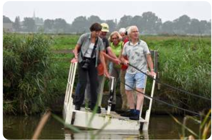
Op het pontje

En toen lag er ineens een watertje tussen ons en de plek waar we moesten zijn. Een trekpontje bood uitkomst. Dit is maar net goed afgelopen, je moet n.l. wel een beetje het gewicht verdelen over beide zijden, heel fanatiek trekken is ook niet aan te raden en de beste schippers stonden natuurlijk weer aan wal.