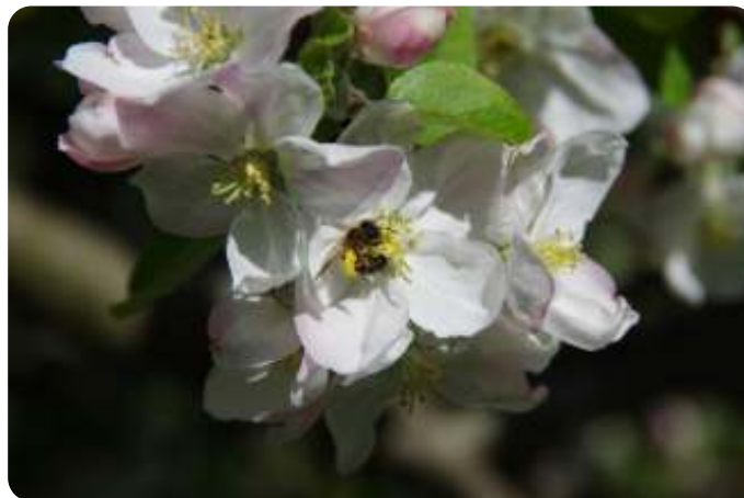
Andrena zwaarbeladen op appel

Sommige wilde bijensoorten vliegen op veel verschillende soorten bloemen, maar andere soorten hebben een sterke voorkeur voor specifieke plantensoorten. In de boomgaard willen we in elk geval de bijensoorten die ook op onze fruitsoorten vliegen. De gehoornde metselbij heeft een voorkeur voor planten uit de rozenfamilie (zoals kers en peer), maar is daar niet alleen van afhankelijk. De rosse metselbij heeft een grote voorkeur voor eikenstuihmeel, maar bezoekt daarnaast ook effectief de bloesem van bijvoorbeeld appel of blauwe bes.