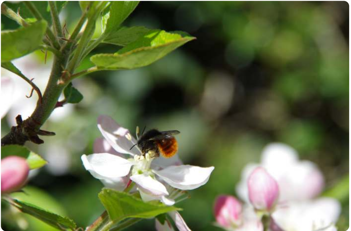
Gehoornde metselbij op appel