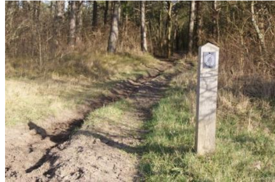
Figuur 1. Uitgesleten ruiterspad

De verharding zorgt er bij een peerdenpad voor dat dit niet gebeurt als er door een paard getrokken karren rijden. Peerdenpaden werden natuurlijk alleen aangelegd op drukke routes.