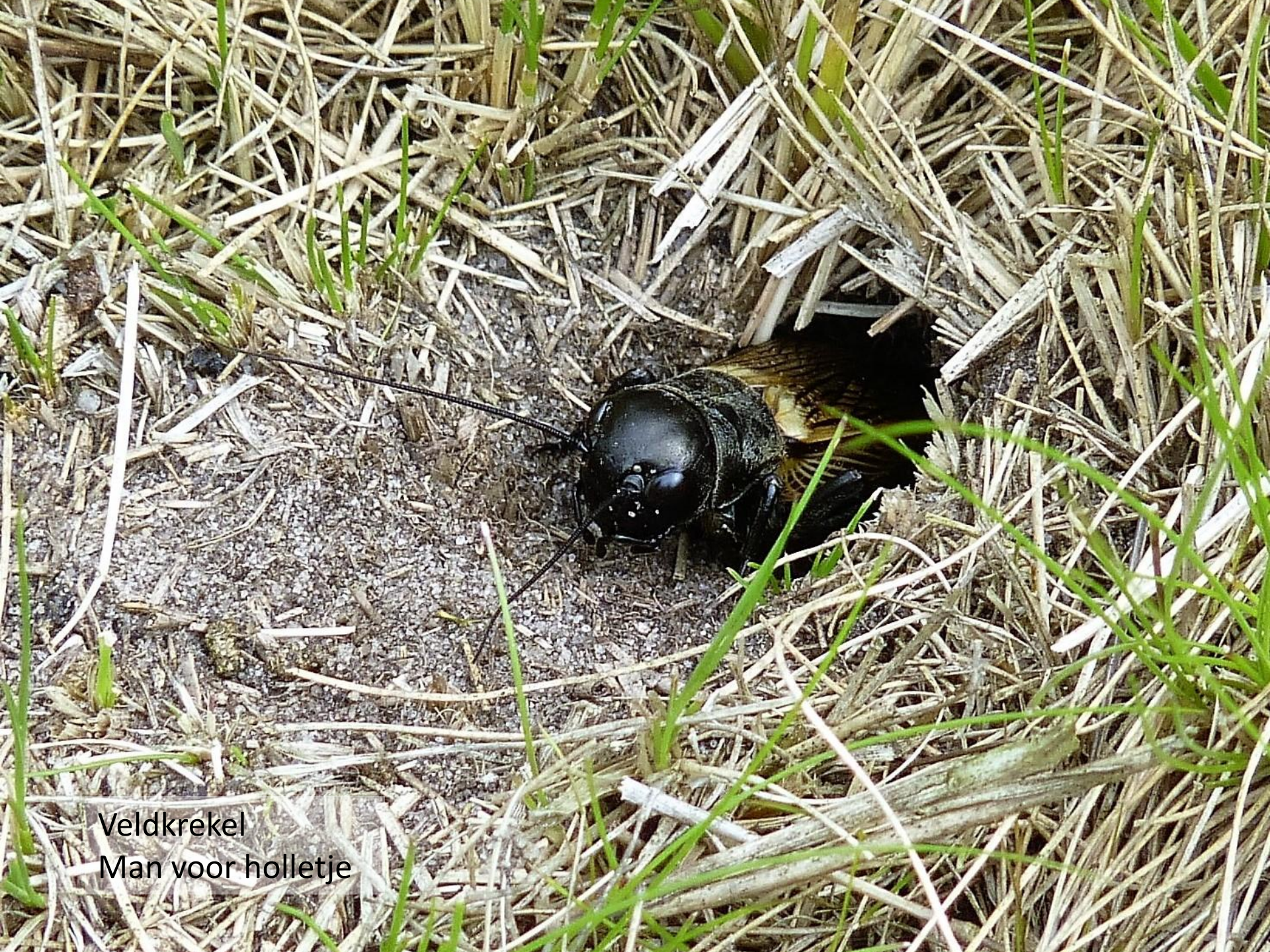
Veldkrekel Man voor holletje