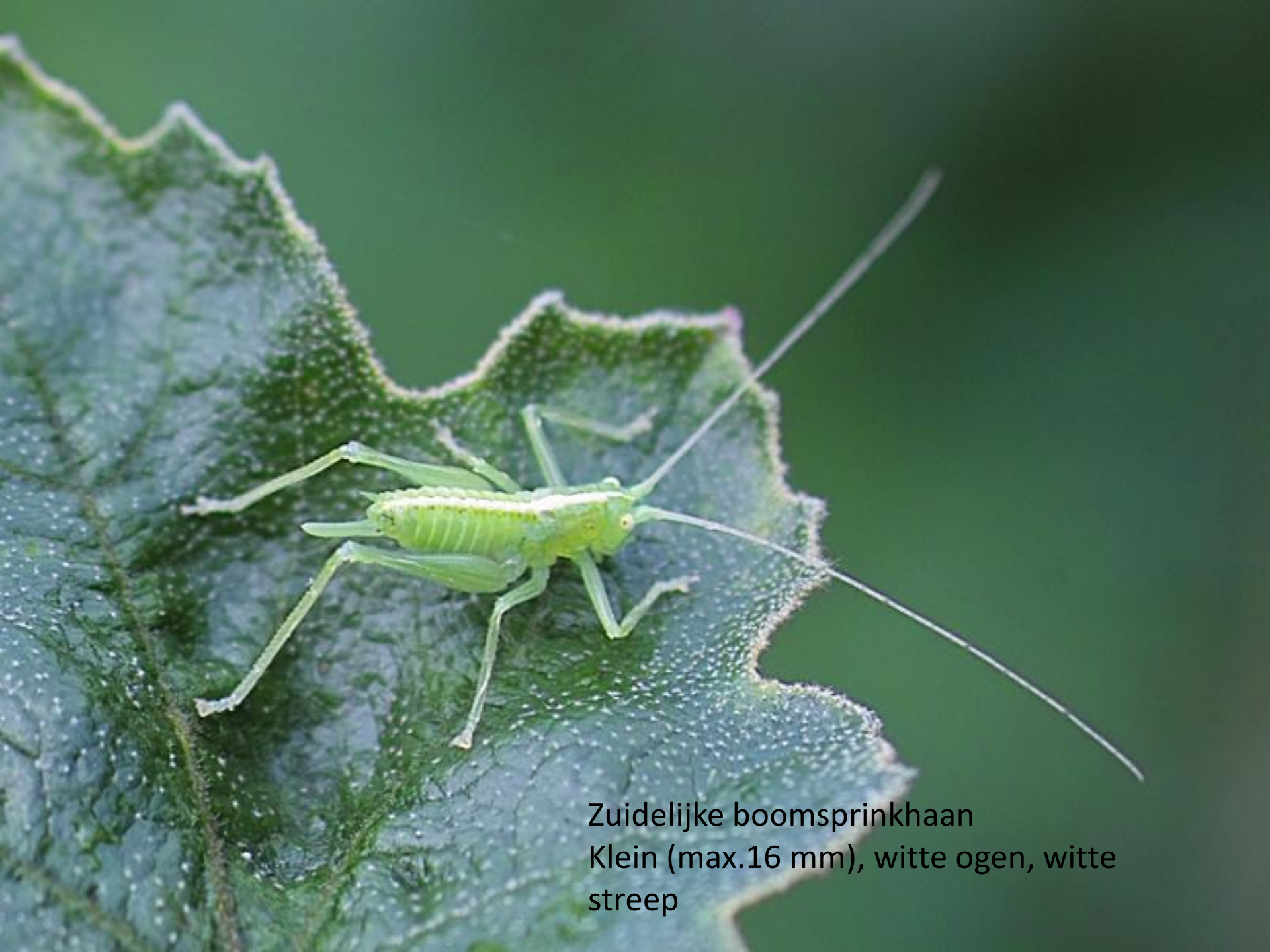
Zuidelijke boomsprinkhaan Klein (max.16 mm), witte ogen, witte streep