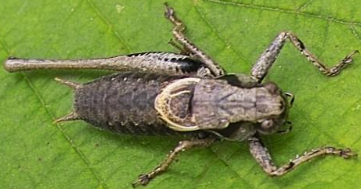
Bramensprinkhaan Man Zeer kort gevleugeld