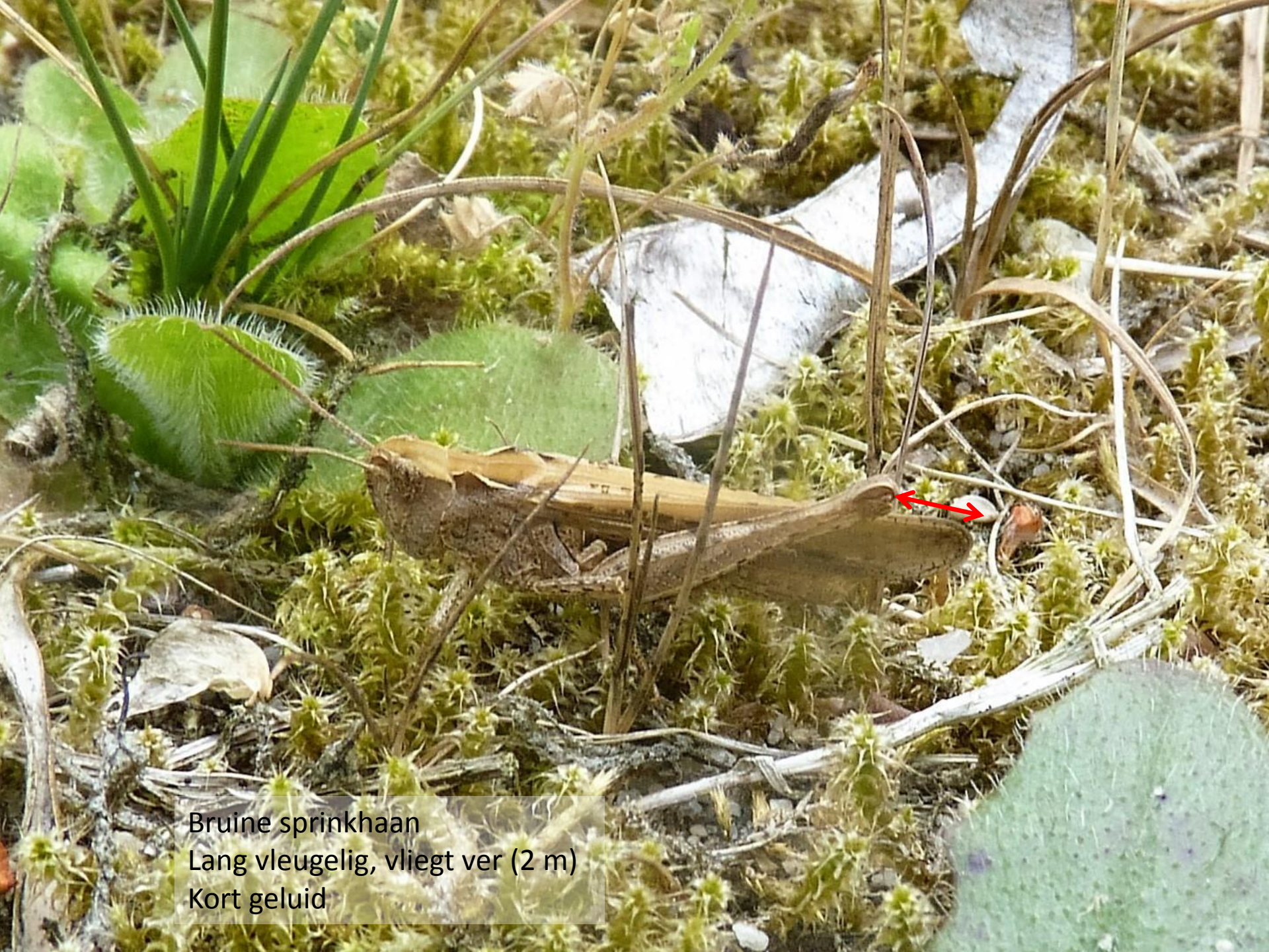
Bruine sprinkhaan Lang vleugelig, vliegt ver (2 m) Kort geluid