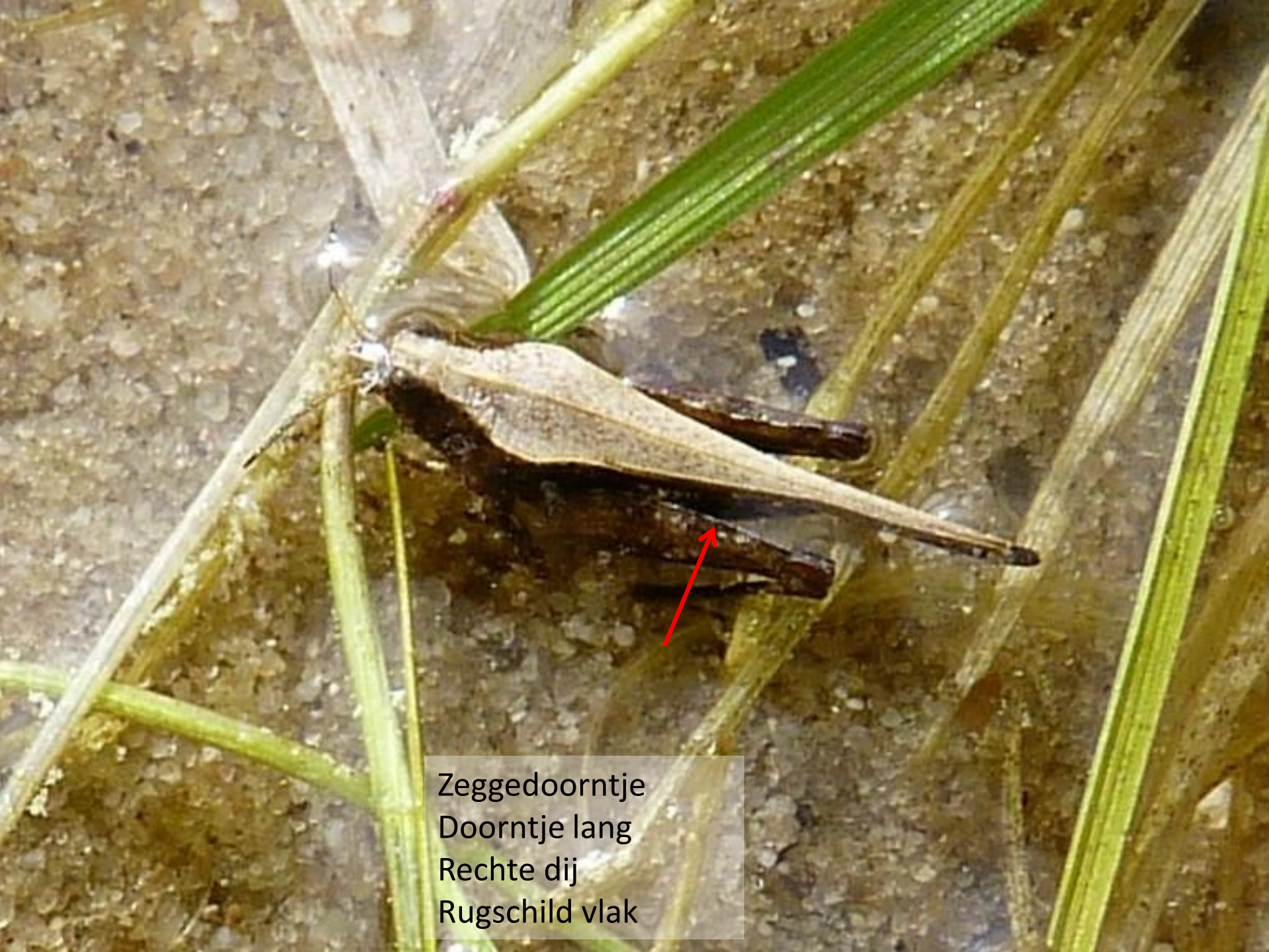
Zeggedoorntje Doorntje lang Rechte dij Rugschild vlak