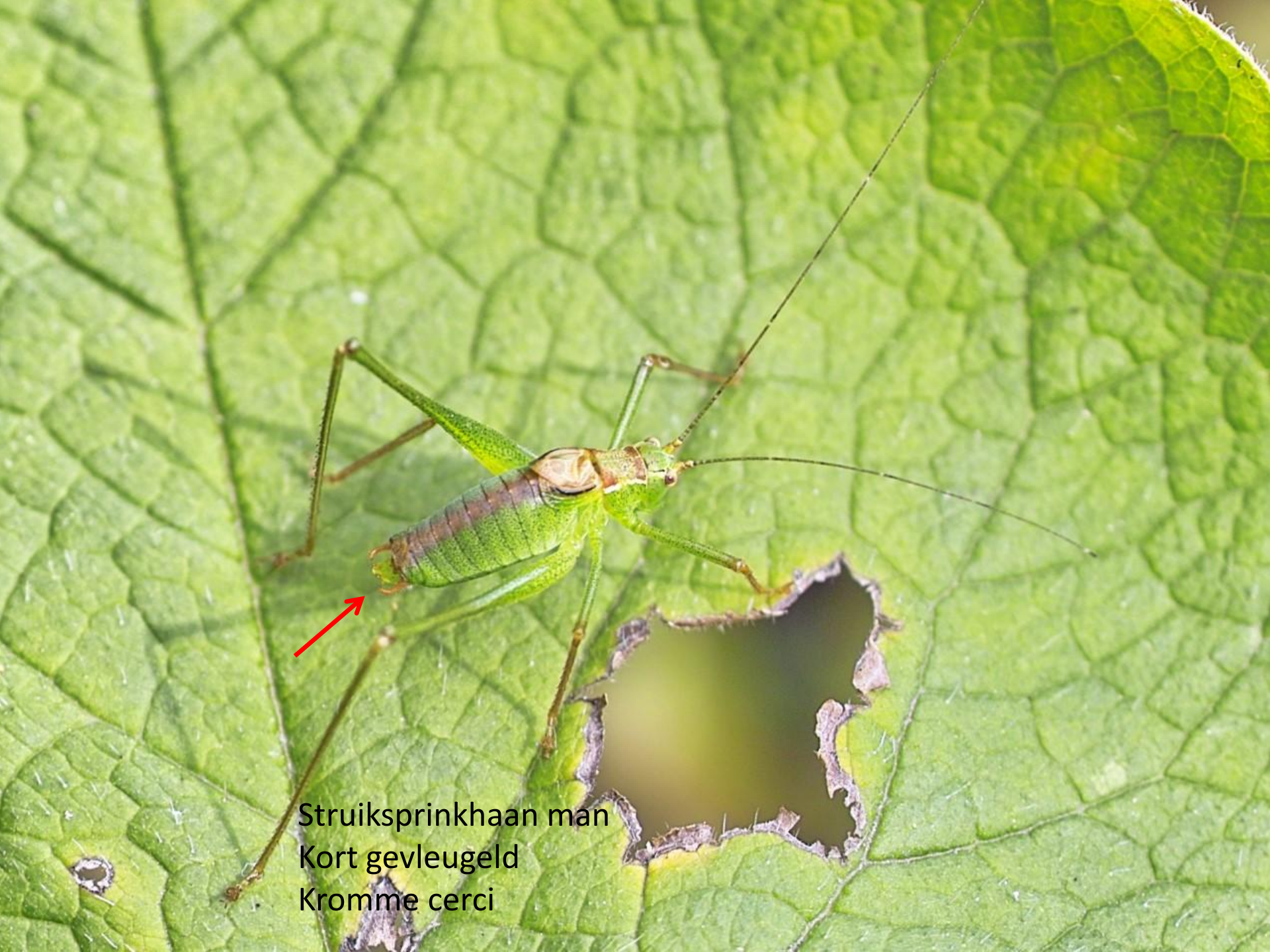
Struiksprinkhaan man Kort gevleugeld Kromme cerci