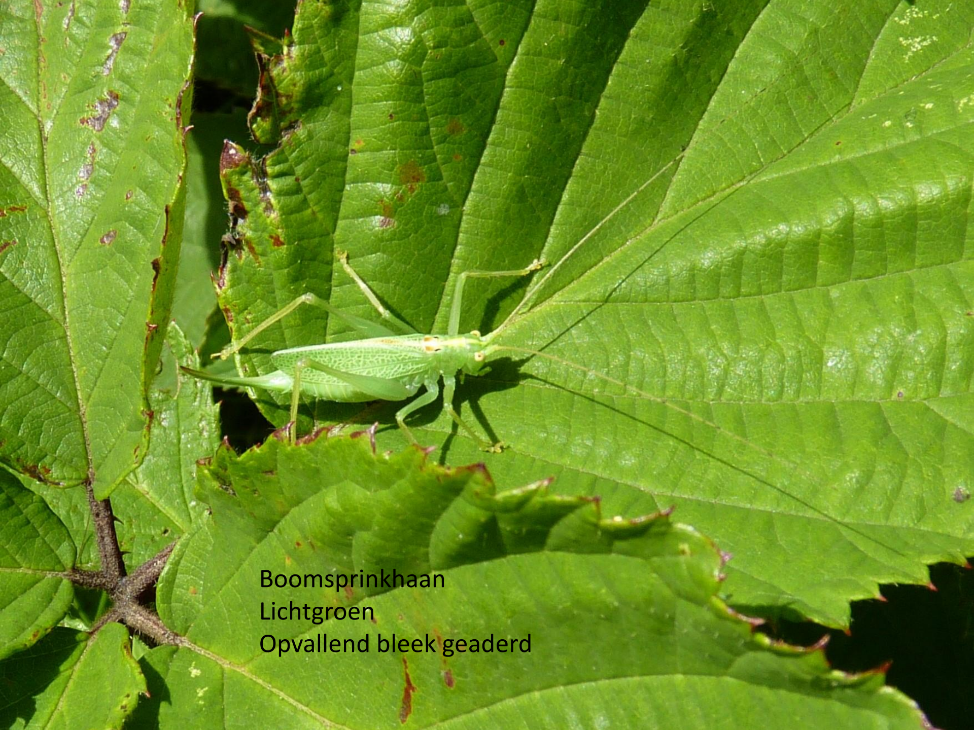
Boomsprinkhaan Lichtgroen Opvallend bleek geaderd