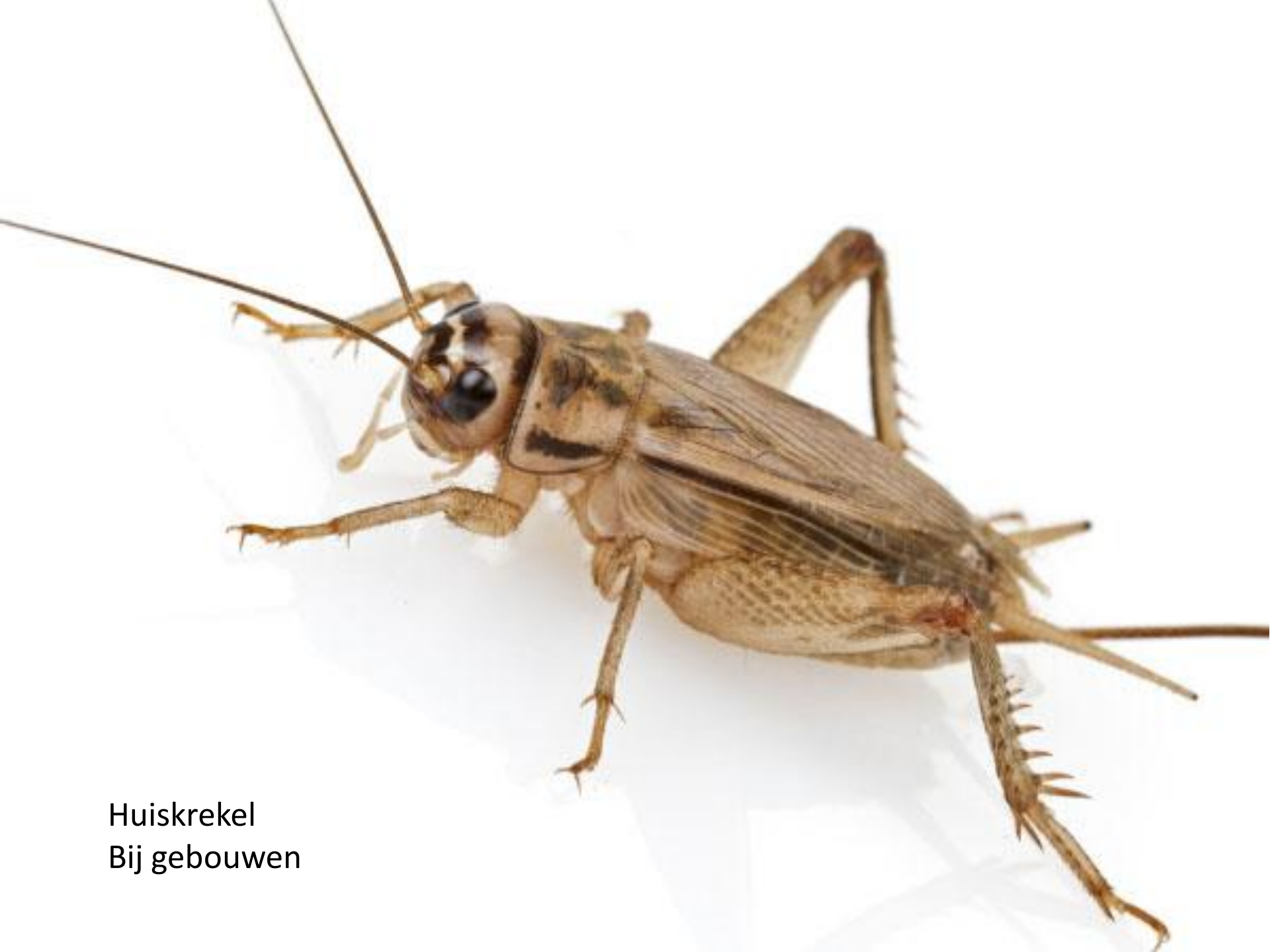
Huiskekel Bij gebouwen