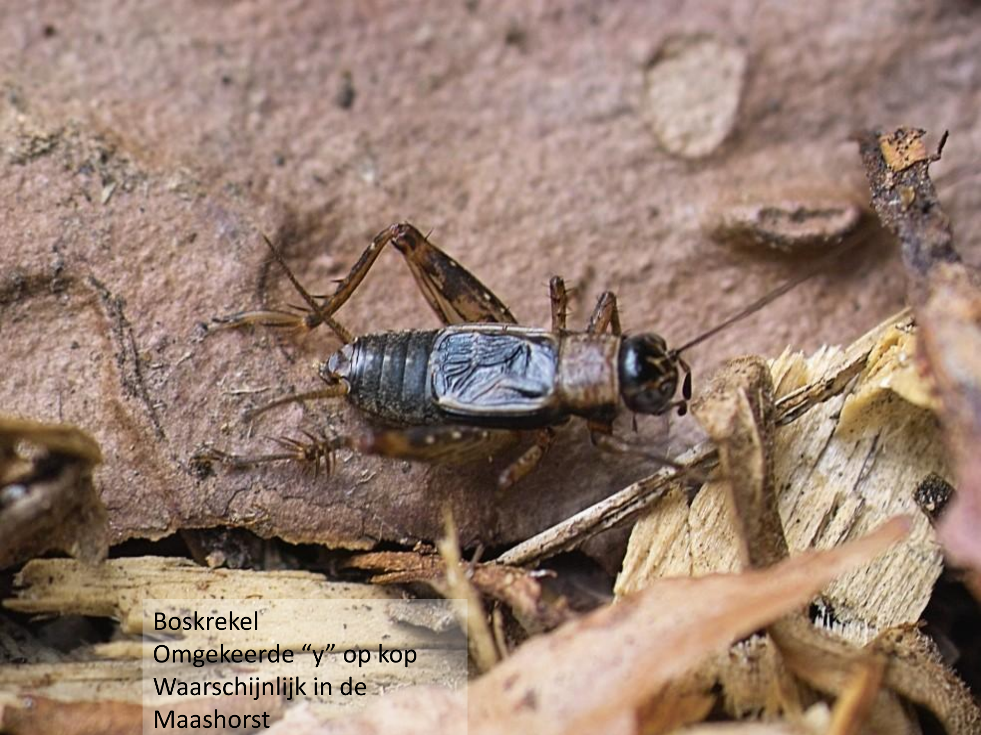
Boskrekel Omgekeerde "y" op kop Waarschijnlijk in de Maashorst