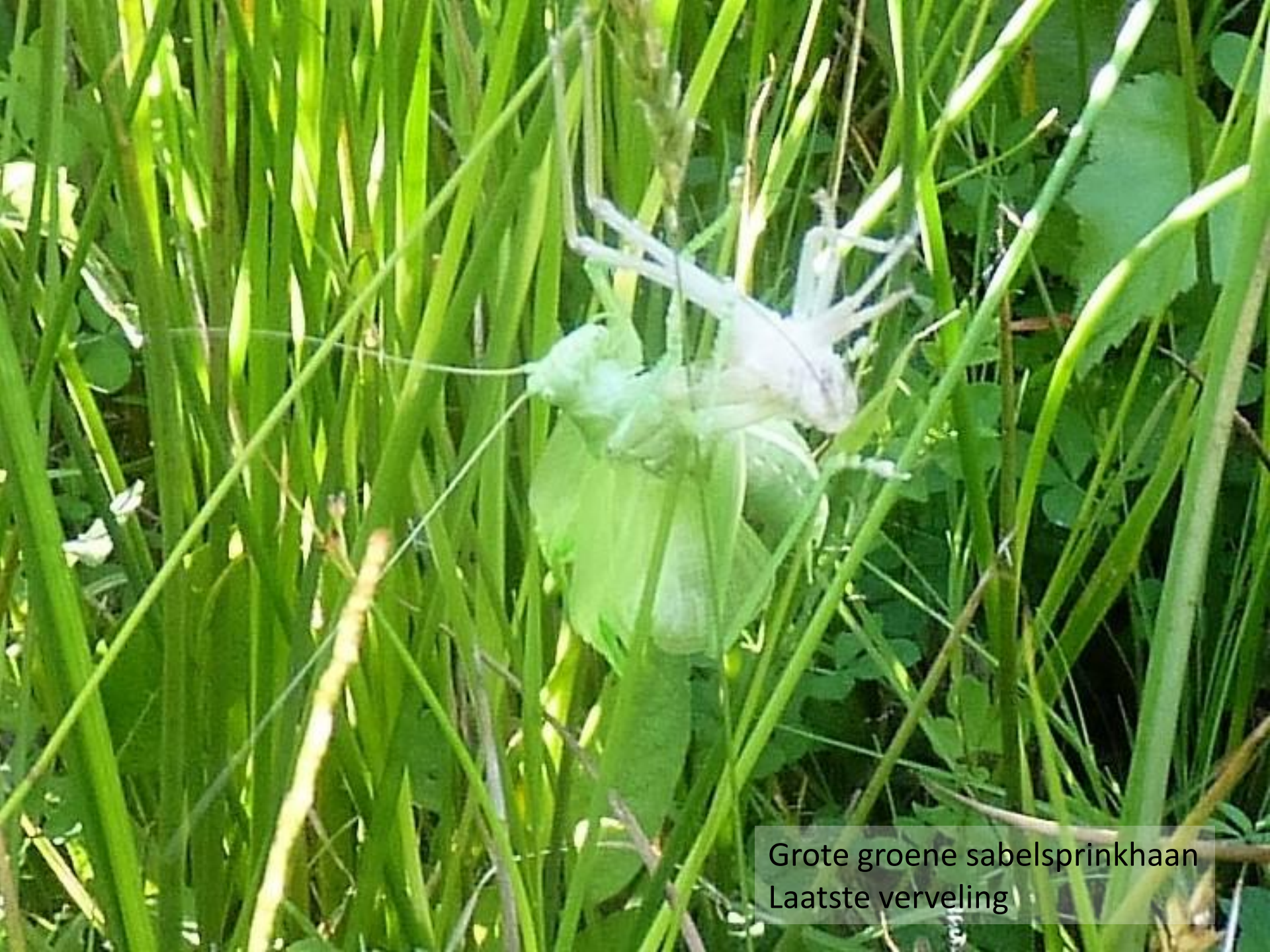
Grote groene sabelsprinkhaan Laatste verveling