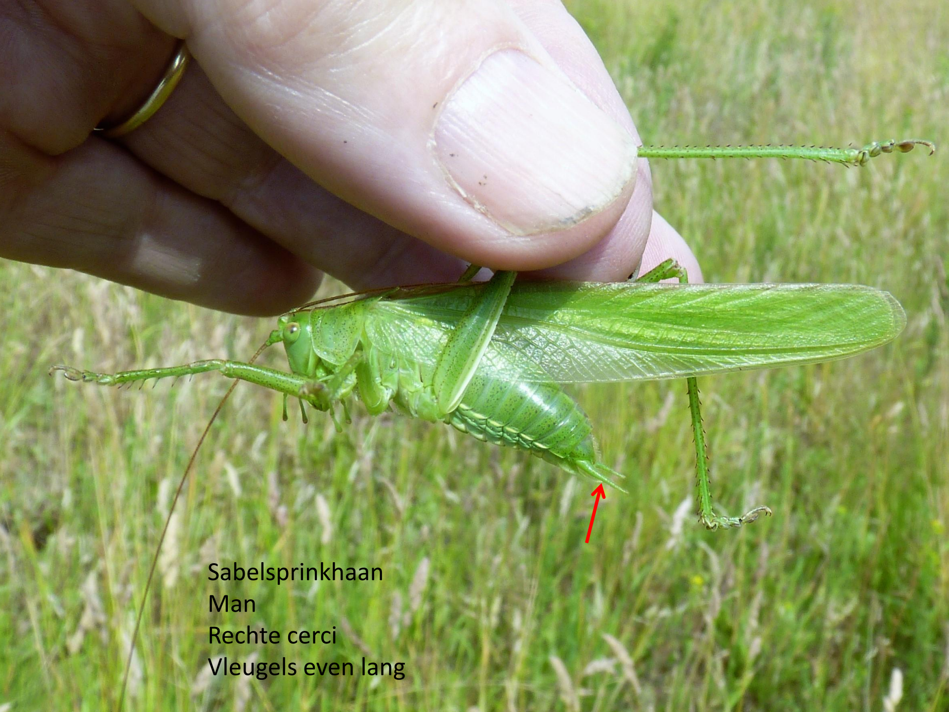
Sabelsprinkhaan Man Rechte cerci Vleugels even lang