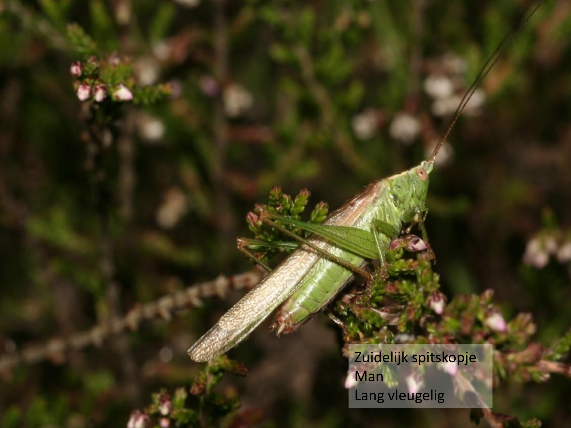
Zuidelijk spitskopje Man Lang vleugelig