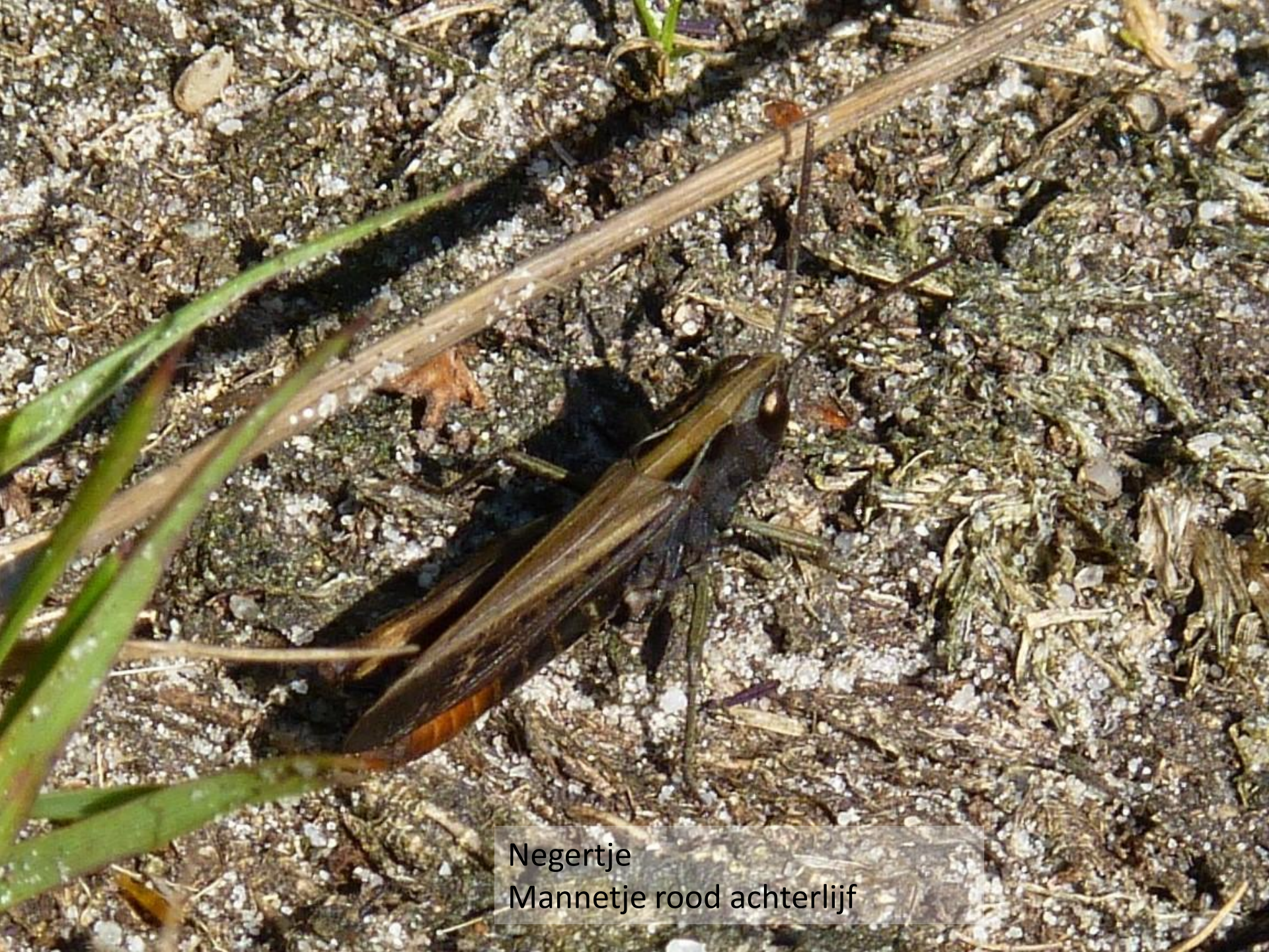
Negertje Mannetje rood achterlijf