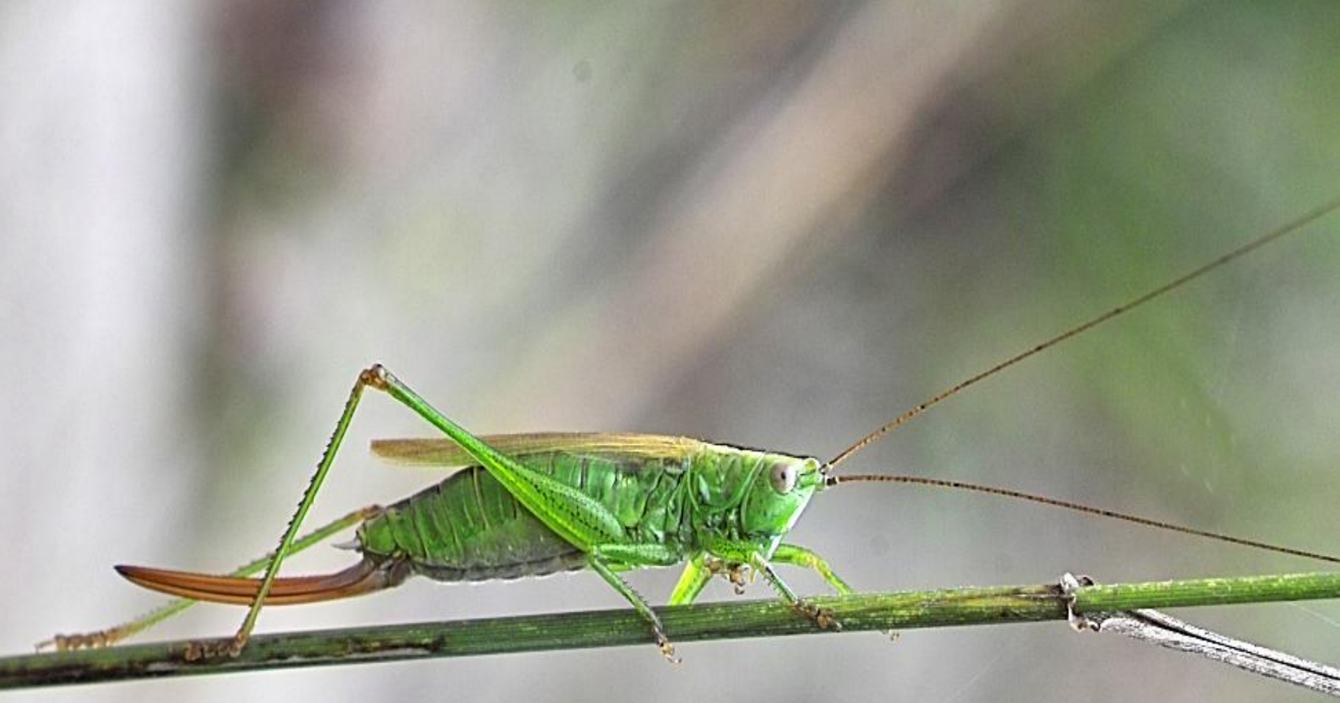
Zuidelijk spitskopje Vrouw Rechte legboor Lang vleugelig