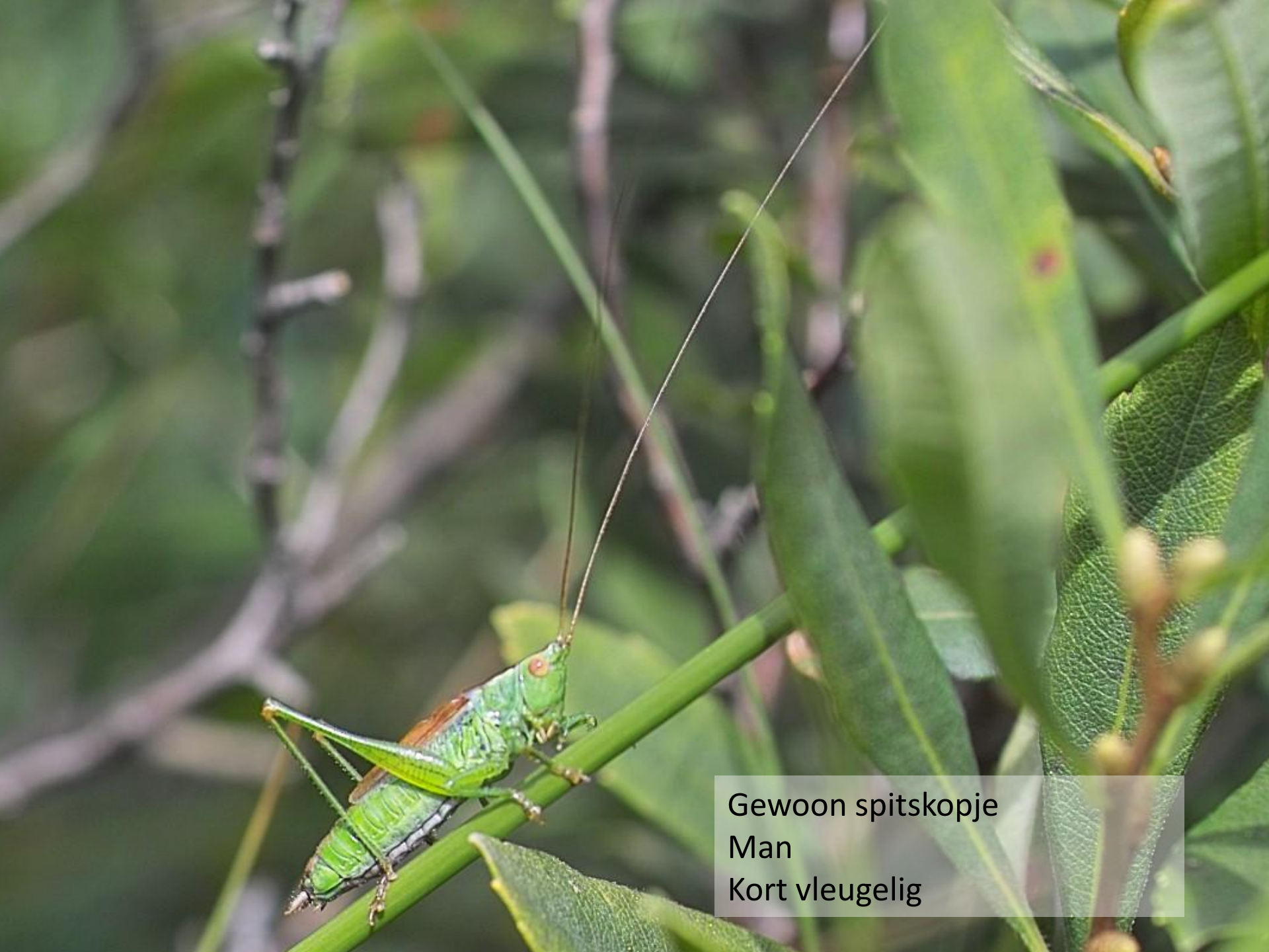
Gewoon spitskopje Man Kort vleugelig