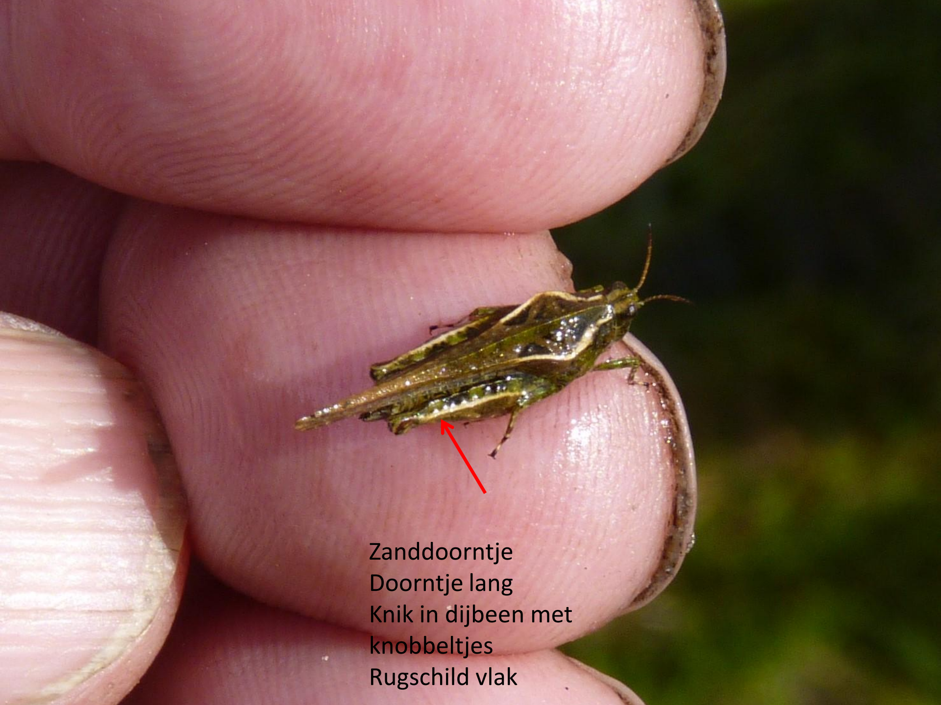
Zanddoorntje Doorntje lang Knik in dijbeen met knobbeltjes Rugschild vlak