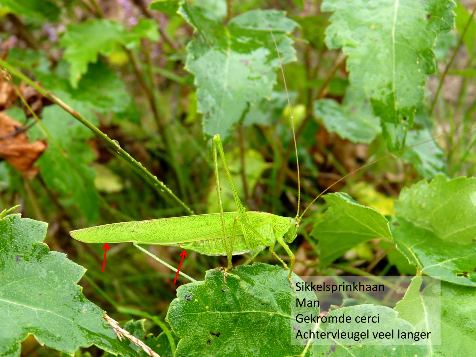
Sikkelsprinkhaan Man Gekromde cerci Achternvleugel veel langer