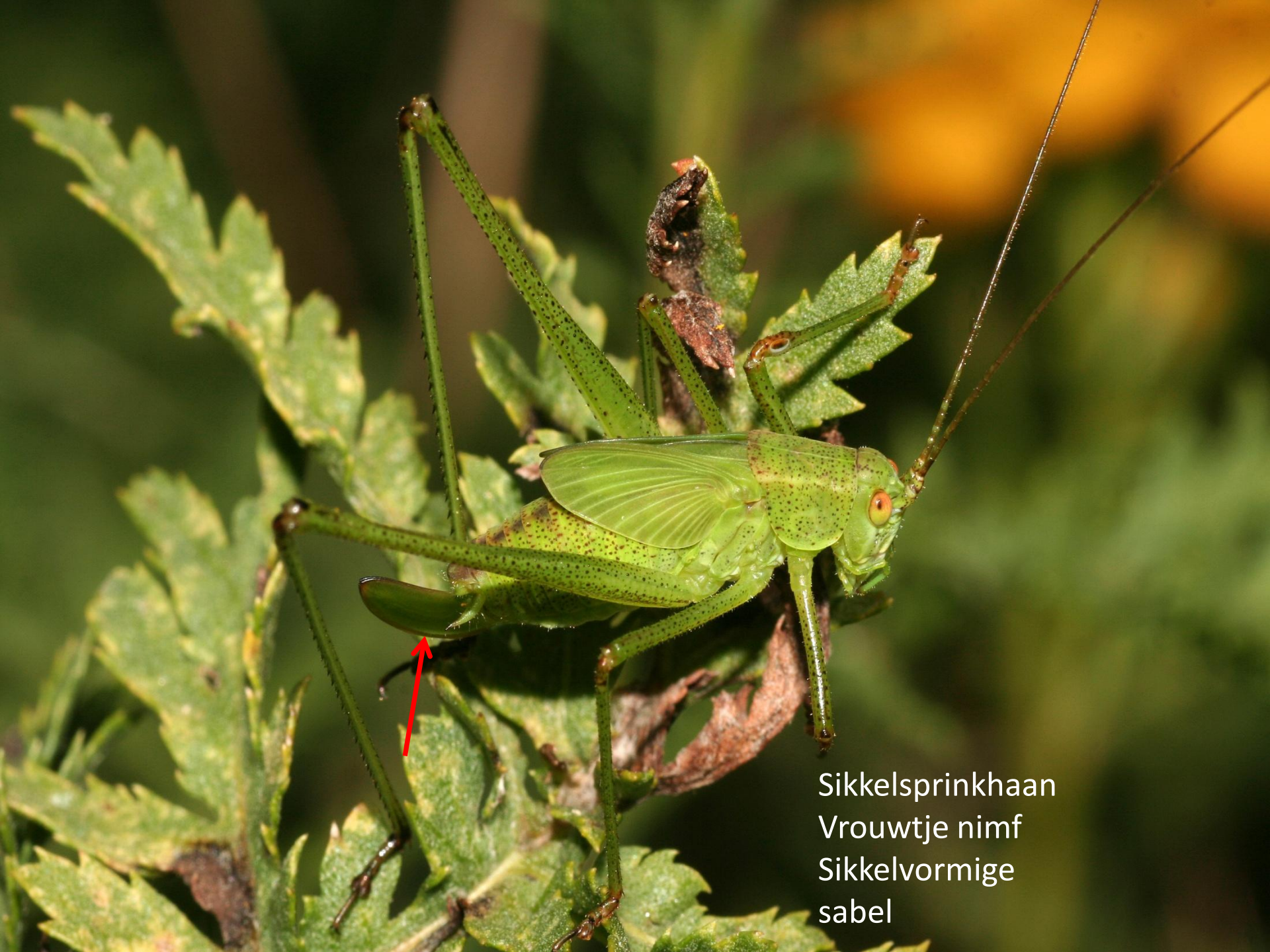
Sikkelsprinkhaan Vrouwtje nimf Sikkelvormige sabel