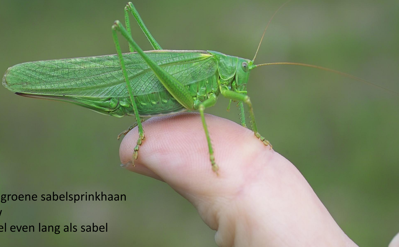
Grote groene sabelsprinkhaan Vrouw Vleugel even lang als sabel