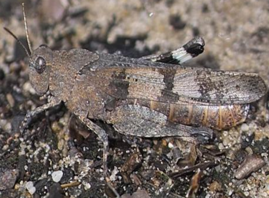
Blauwvleugelsprinkhaan In vlucht wordt blauwe achtervleugel zichtbaar