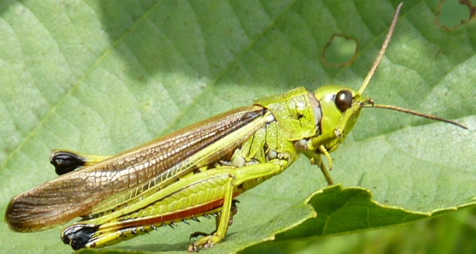
Moerassprinkhaan Man Rode streep op dij