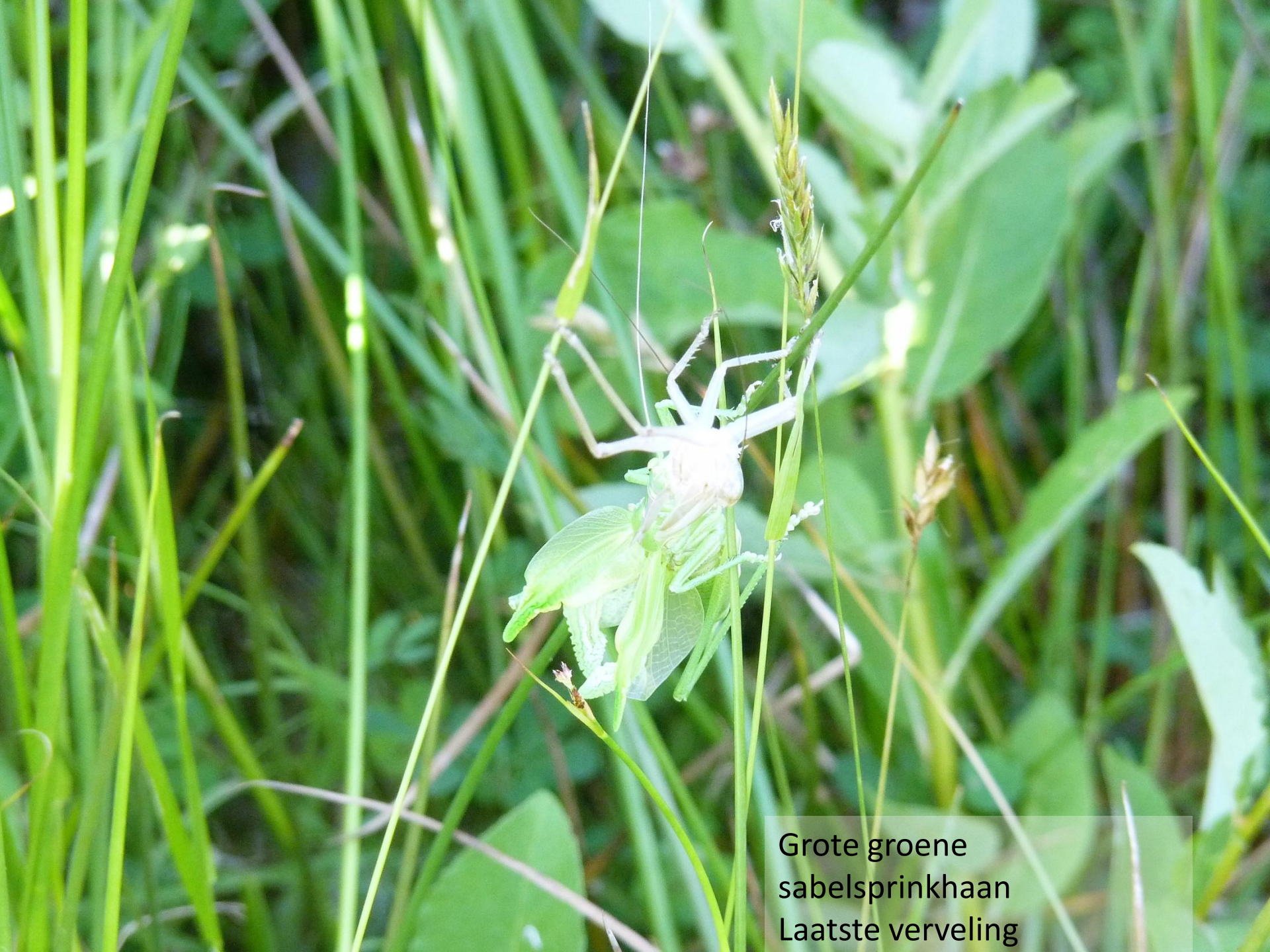
Grote groene sabelsprinkhaan Laatste verveling