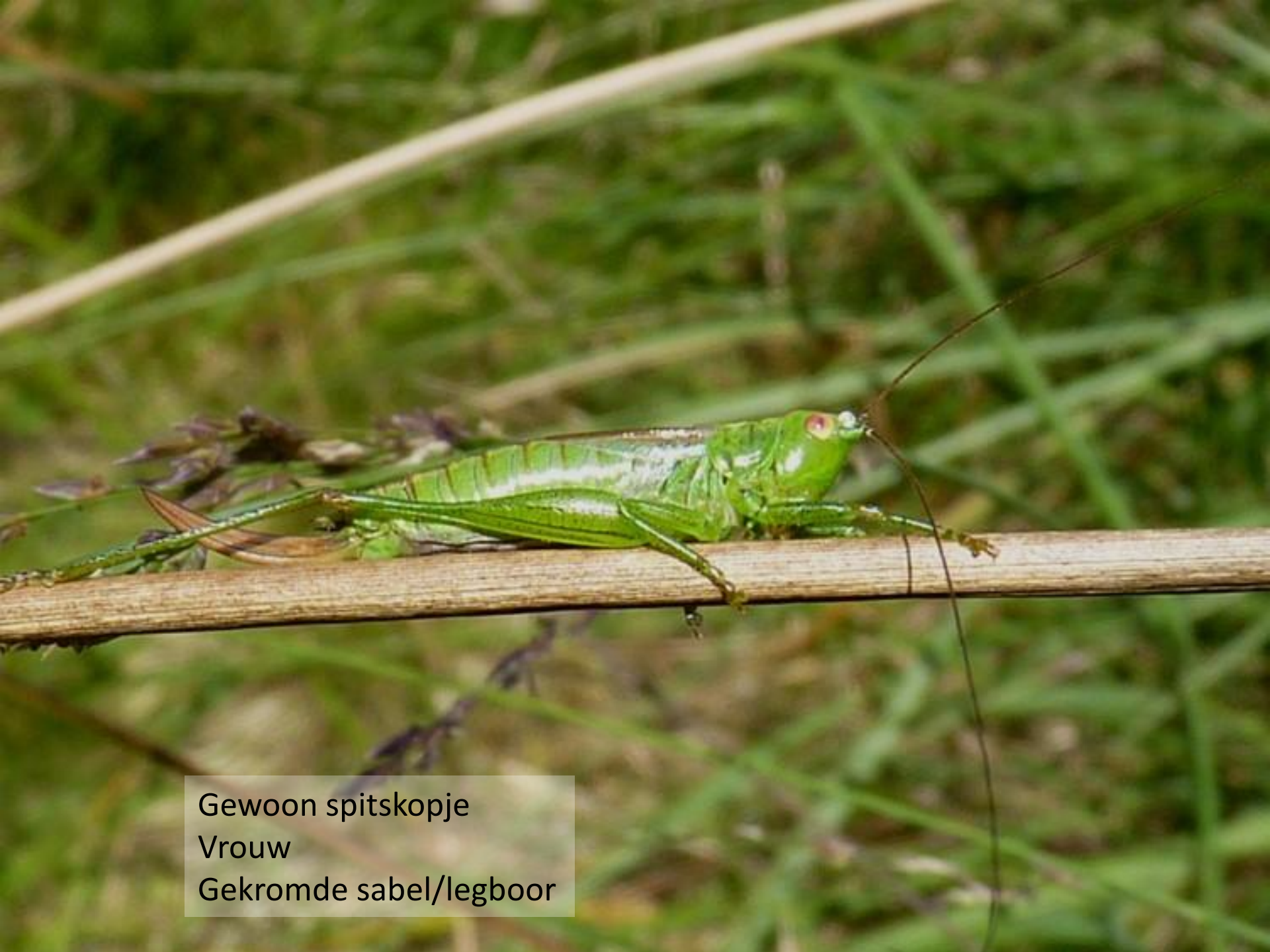
Gewoon spitskopje Vrouw Gekromde sabel/legboor