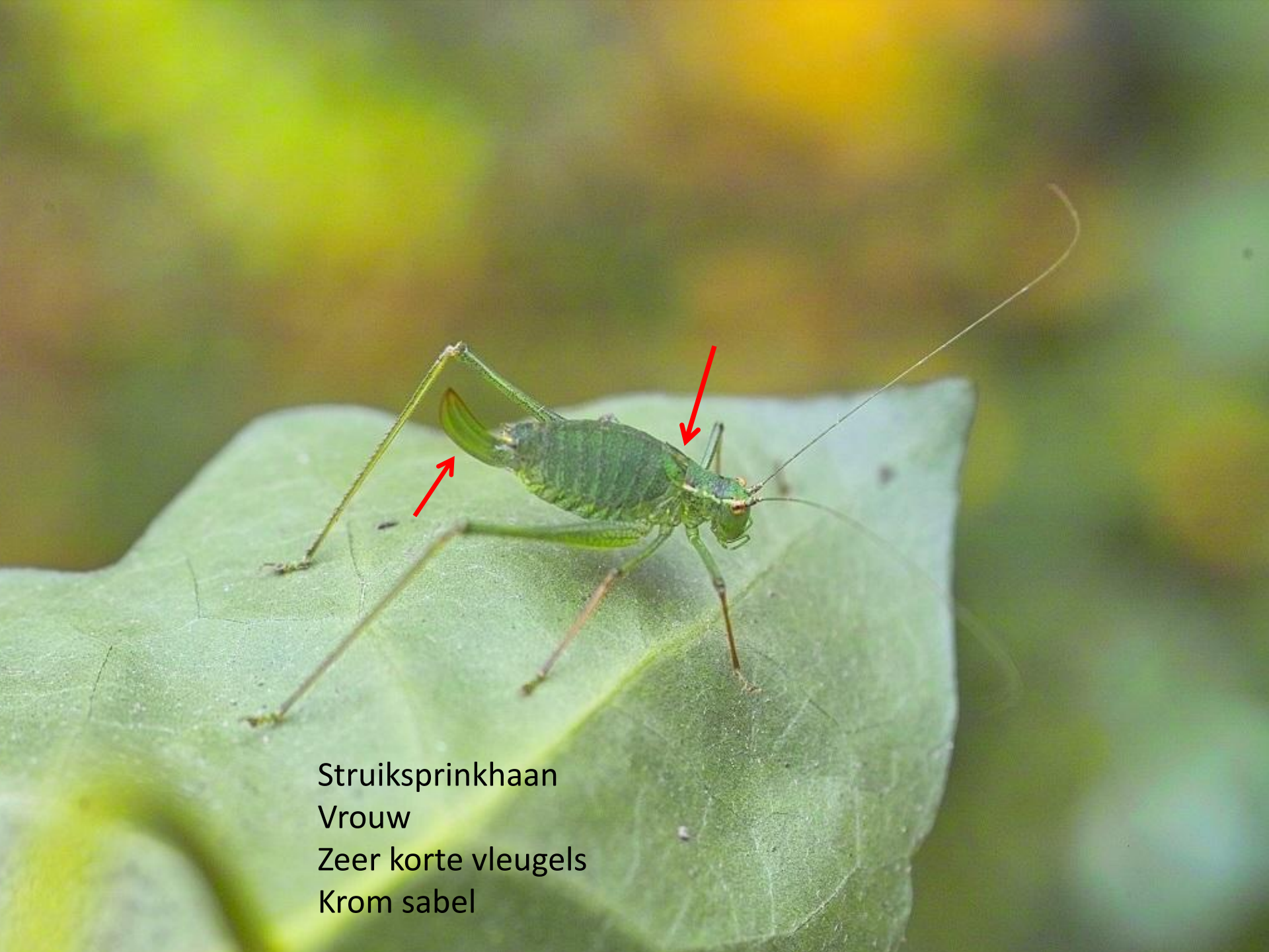
Struiksprinkhaan Vrouw Zeer korte vleugels Krom sabel