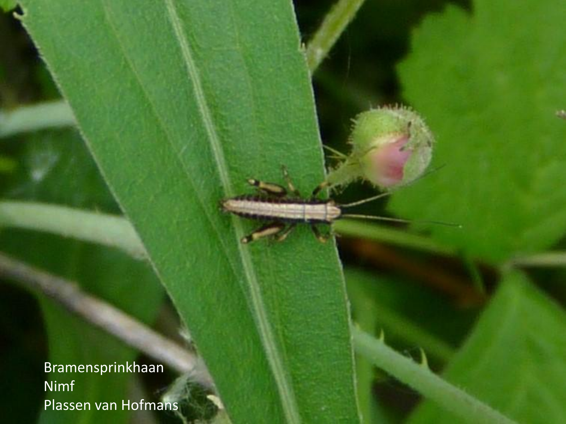
Bramensprinkhaan Nimf Plassen van Hofmans