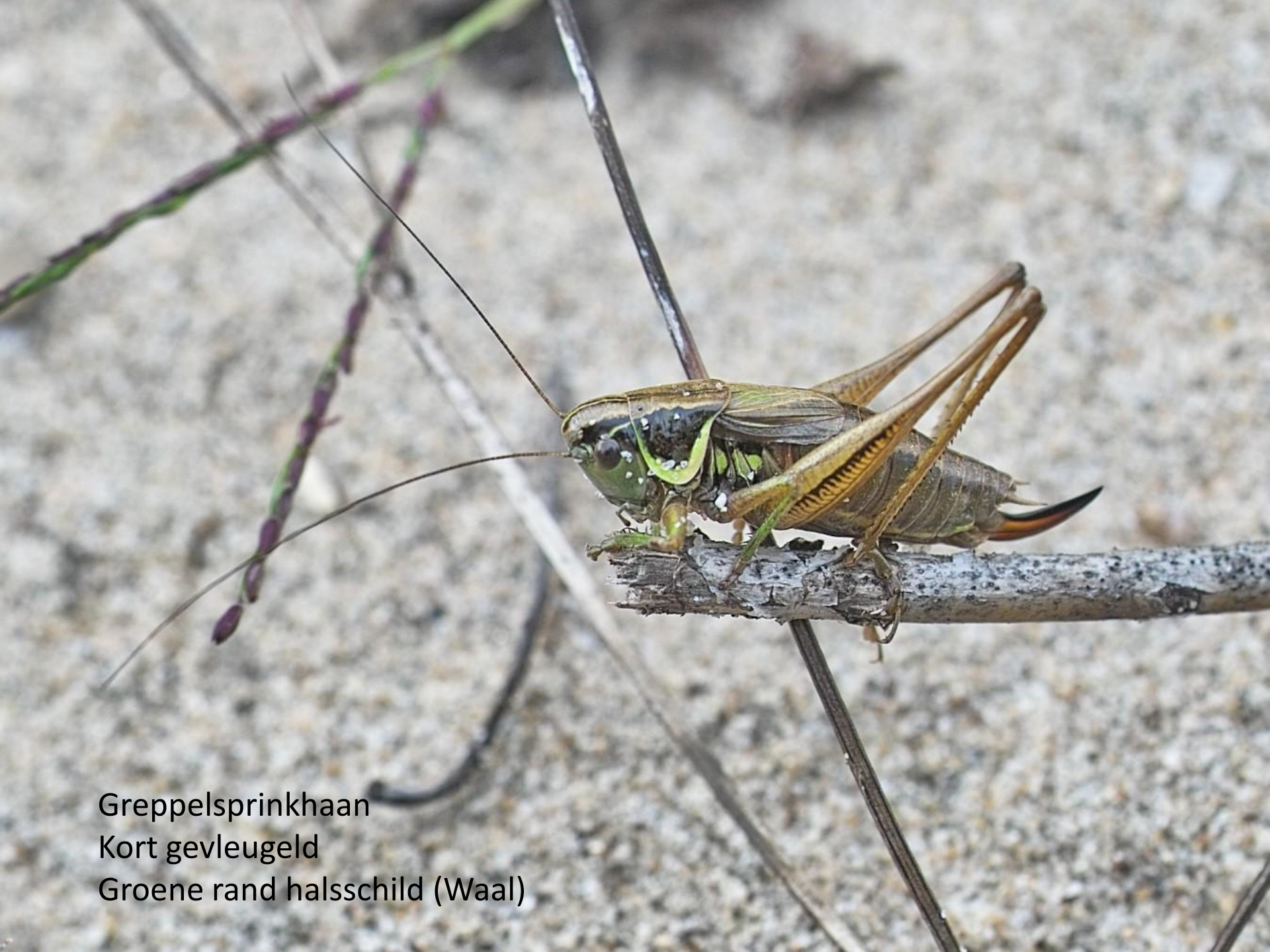
Greppelsprinkhaan Kort gevleugeld Groene rand halsschild (Waal)