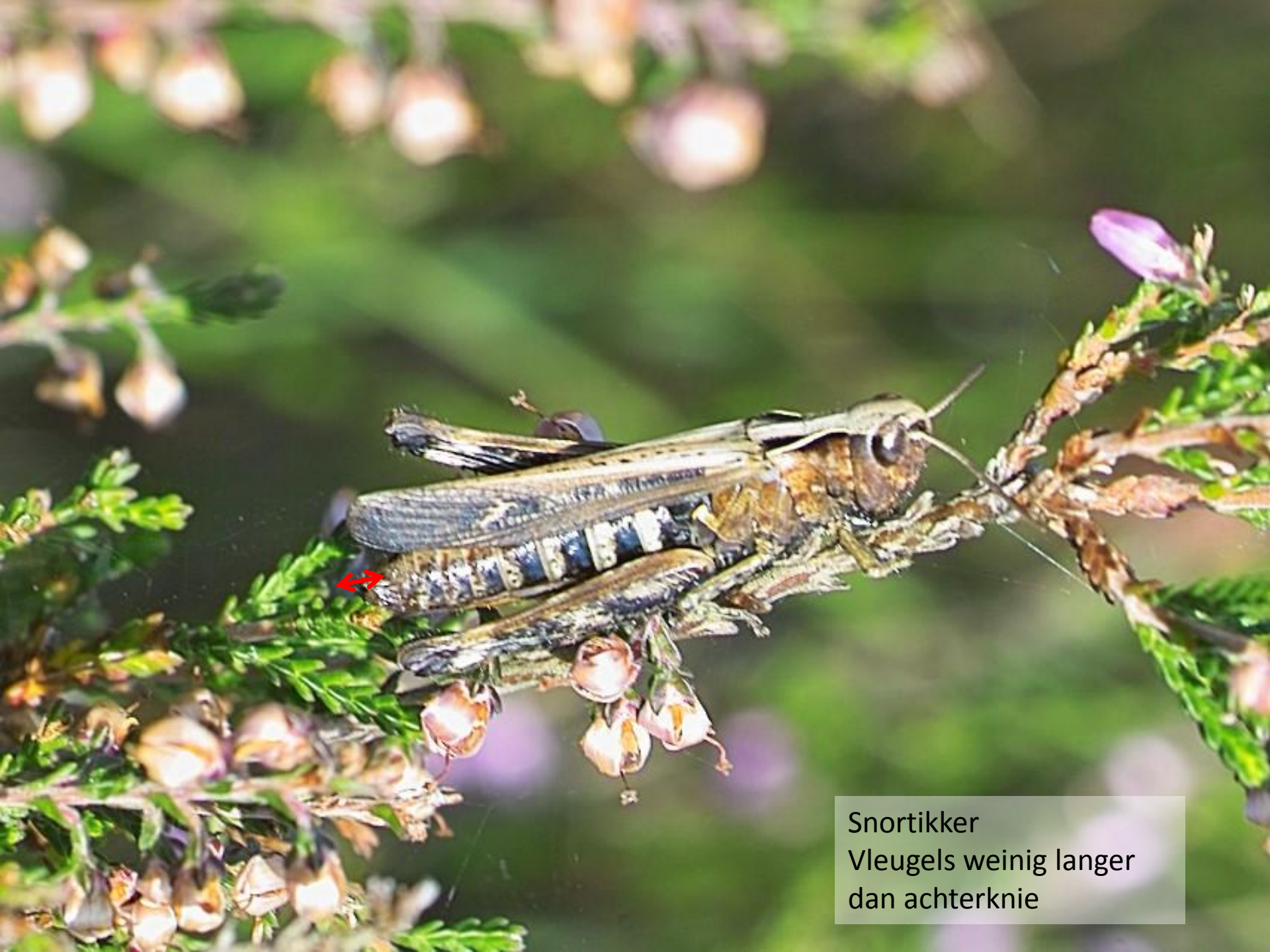
Snortikker Vleugels weinig langer dan achterknie