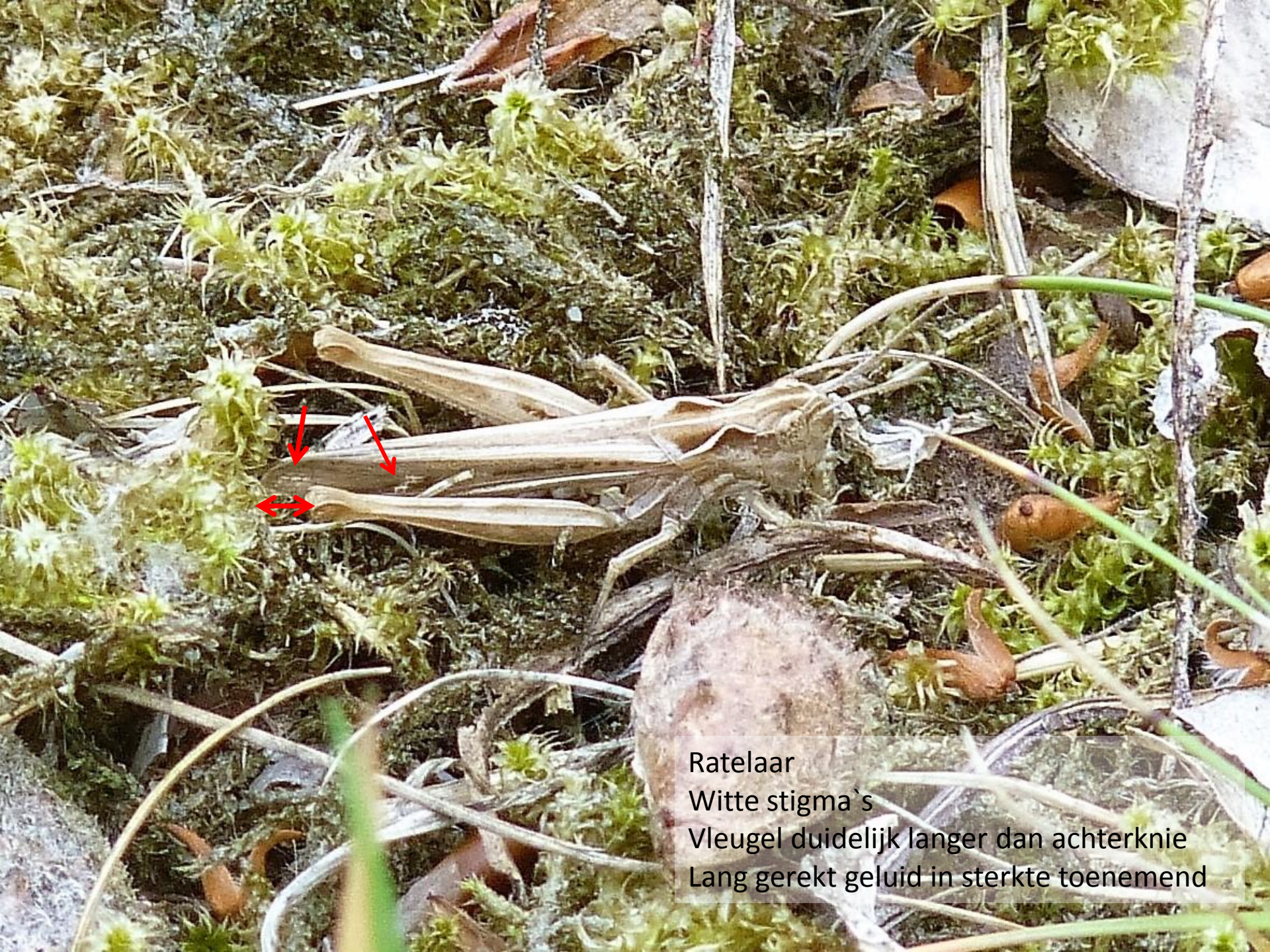
Ratelaar Witte stigma's Vleugel duidelijk langer dan achterknie Lang gerekt geluid in sterkte toenemend