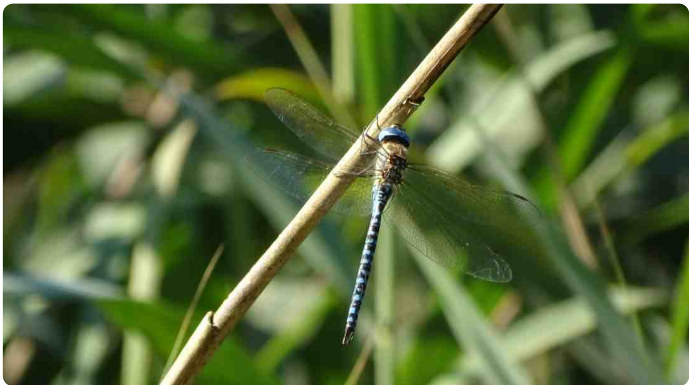
de waterwerkgroep trof deze zeldzame zuidelijke glazenwasser aan bij een pool aan de Nagelmekerseweg in Veldhoven