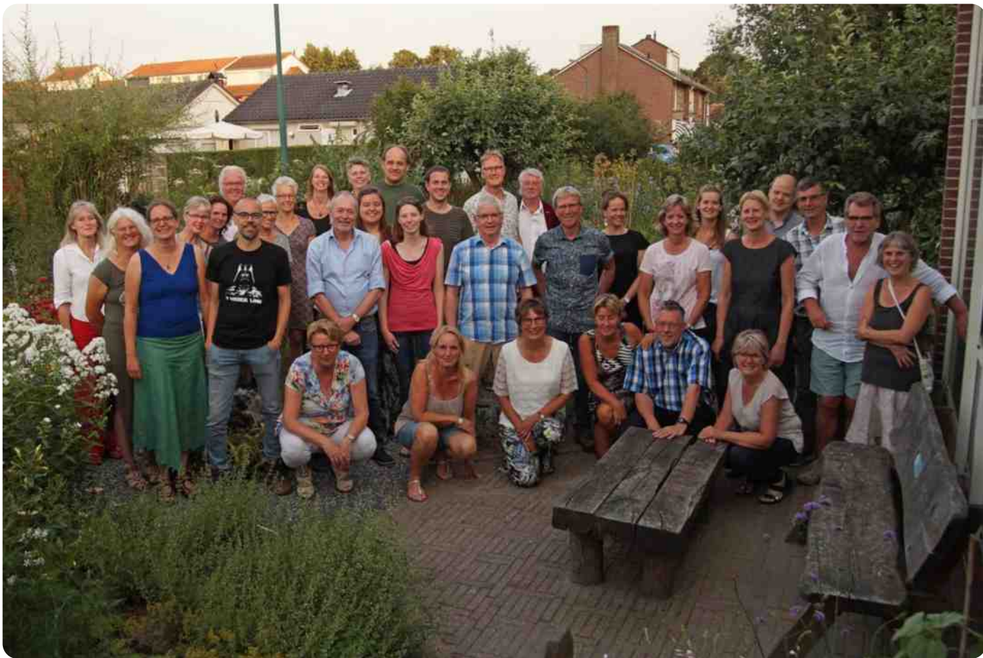
Geslaagde cursisten en cursusteam

Naast de standaardonderwerpen zoals planten, dieren, geologie, landschap en didactiek werd er ook uitgebreid aandacht besteed aan, onder meer, energieopwekking, afvalverwerking, natuurbeheer en gemeentelijke groenbeleidsplannen. Omdat kennis daarvan binnen het IVN slechts beperkt aanwezig is, werden er ook docenten van buitenaf aange trokken, waaronder Natuurmonumenten, gemeente Veldhoven en Eindhoven, Waterschap de Dommel en Staatsbosbeheer.