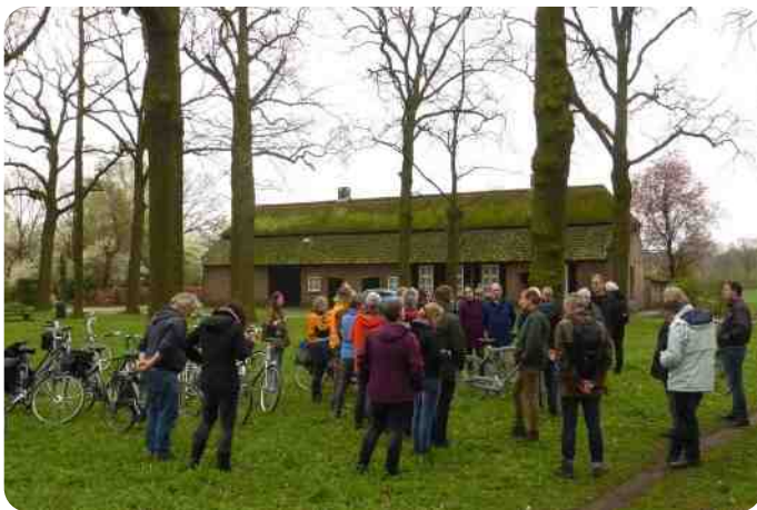
Fietsexcursie over heemkunde

Onder de nieuwe gidsen zijn er die qua kennis op bepaalde gebieden niet onderdoen voor de docenten. Anderen hebben een natuurlijke of aangeleerde gave om aan een groep iets uit te leggen of deze met een aardig verhaal te boeien. Sommigen hebben zelfs beide vaardigheden. Maar er zijn er natuurlijk ook die op deze terreinen nog het één ander te leren hebben. Is dat een gemiste kans? Nee, allerm minst, want zonder uitzondering hebben we hier te maken met enthousiaste en gemotiveerde mensen en wij, als cursusteam, hebben geen enkele twijfel dat iedereen uiteindelijk zijn of haar draai zal vinden in het uitdragen van de natuurgedachte, in IVN- of ander verband.