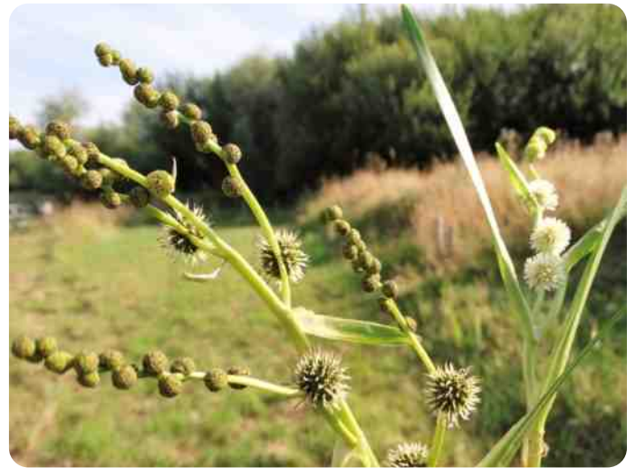
Grote en kleine egelskop