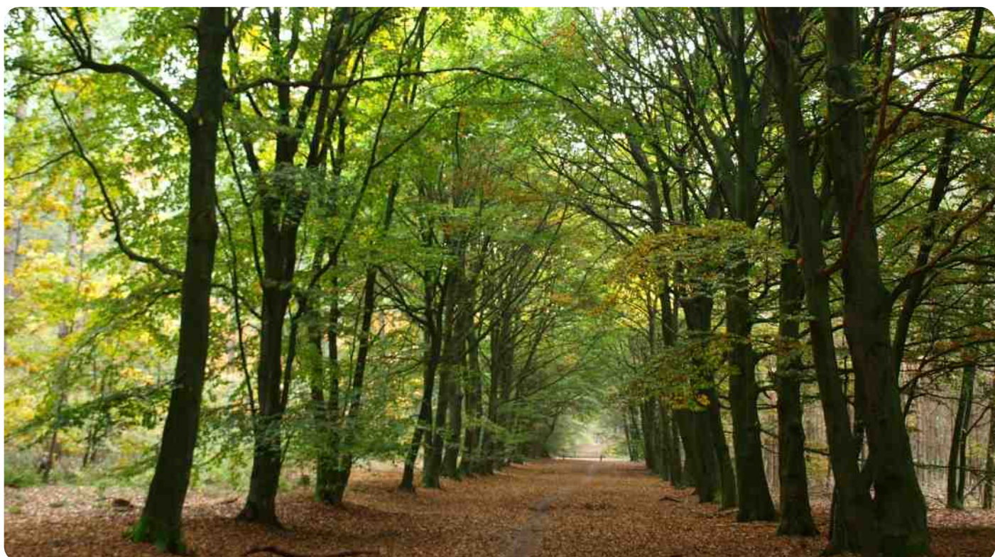
herfst