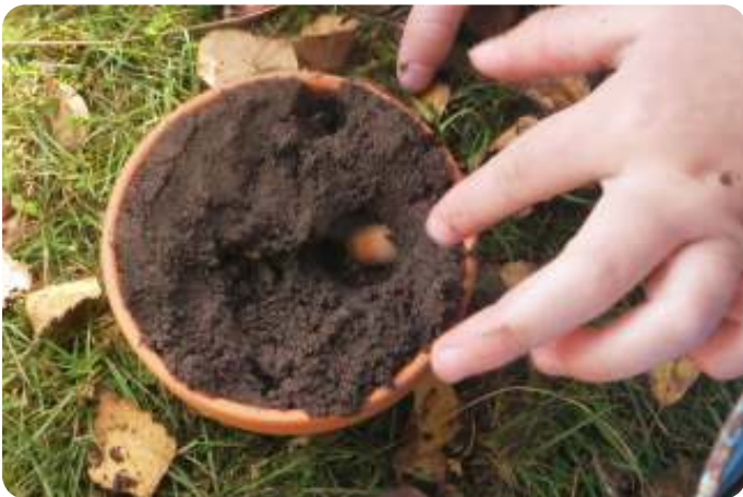
Eekhoorns begraven eikels

Dag allemaal, hopelijk zien we jullie allemaal weer op zondag 30 januari 2022 voor de vogels.