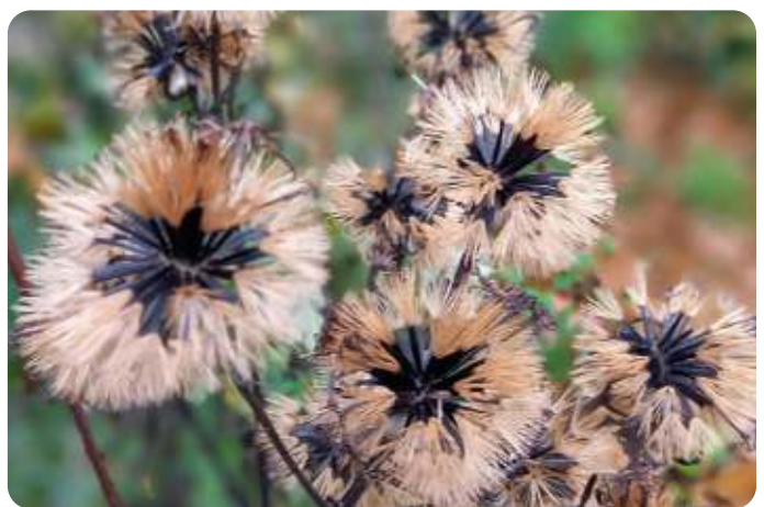
Zaden van kruiskruid