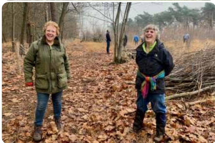
Werken met ASML aan de Turfweg