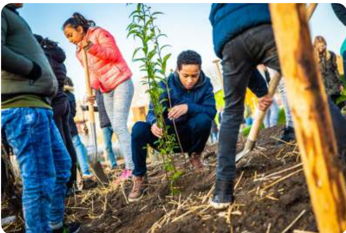
Tiny forest aanplanten

Het is spannend wat er uitkomt. Welke ideeën blijven overeind? IVN Brabant begeleidt dit traject. Ik vond het verrassend wat ze allemaal al op papier hadden gezet. Een beetje stil werd ik bij het eerste groepje, dat vooral veel schaduw wilde creëren. Op mijn vraag waarom, kreeg ik het antwoord dat je niet op je mobiel kan kijken met felle zon.... Oké dat was het eerste groepje, bij de volgenden was dat niet zo'n issue. De anderen hadden er goed over nagedacht, concepten voor een moestuin voor de schoolkantine, een wateropvang met waterzuivering, innovatieve speelplekken... Van alles kwam langs. Nadat ze feedback hebben gekregen van de experts moeten ze aan de slag voor hun eindpresentatie. De leerlingen hebben twee weken de tijd om hun ontwerp uit te werken en dan gaan ze het presenteren. Het winnende ontwerp zal dan ook daadwerkelijk gerealiseerd worden. Ik ben erg benieuwd naar het vervolg.