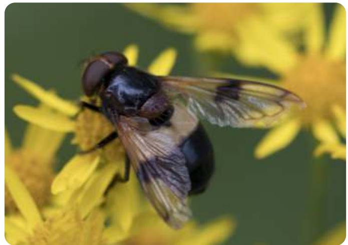
Witte reus

Ze worden gezien in loofbossen parken en tuinen. Bezoekt bloemen zoals de vlinderstruik en linde. Vrouwtjes leggen eitjes in de nesten van de gewone wesp, de Duitse wesp en de hoornaar.