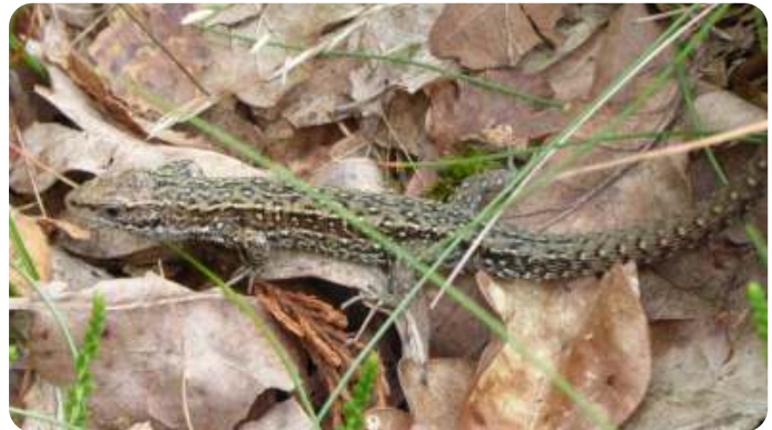
Levendbarende hagedis

Begin 2021 is de gemeente gestart met het project heideherstel De Sprankel. Het doel is om in een aantal jaar een heide- en bosgebied te ontwikkelen met vele bijzondere plant- en diersoorten. In het project moet de gemeente rekening houden met andere partijen, zoals netbeheerder TENNET. In het gebied onder de hoogspanningsmasten aan de Turfweg moet de beplanting laag blijven, om te voorkomen dat vonken van de stroomkabels overslaan. Het westelijke deel van het gebied is van hoge archeologische waarde. Daarom doen we beheer en onderhoud hier zo veel mogelijk zonder machines. Het doel is dat hier struikheide en andere planten gaan groeien die het goed doen op heidegrond. Omdat onze activiteiten heel precies uitgevoerd kunnen worden, boompje voor boompje, is dit een ideale locatie voor de activiteiten van Natuuractie(f) deze winter.