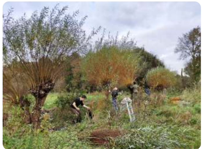
Wilgen knotten langs de Dommel

In dit gebied staan ruim 145 wilgen die om de 3 jaar geknot moeten worden. Er zijn 9 wilgen geknot, 11 wilgenstammen geschoren en een fikse boom klein gemaakt. Dit werk is verricht door 11 personen van KLE en 5 personen van buitenaf. Een wandelaar ging spontaan mee doen