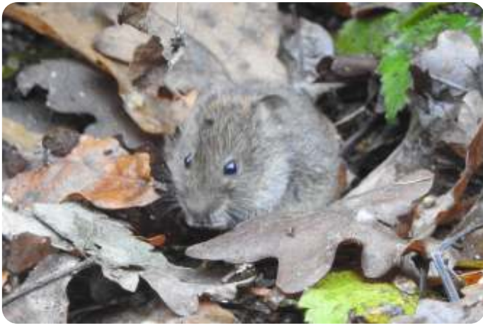
Rosse woelmuis