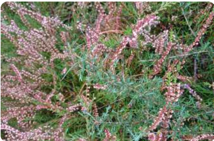
Heide en stekelbrem

In het projectgebied De Sprankel komen verschillende overgangen van droge heide naar bos. Hierdoor kunnen verschillende plant- en diersoorten zich beter ontwikkelen. Bijvoorbeeld de geelgors, levendbarende hagedis, kruipbrem, grote bremraap, zandblauwtje en diverse insecten. Van enkele van deze soorten is bekend, dat ze in de directe omgeving voorkomen.