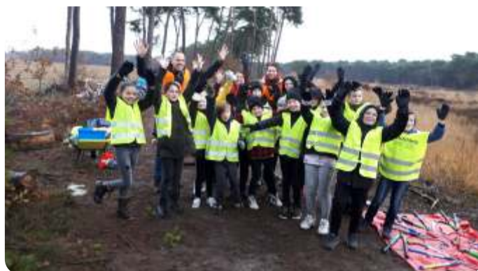
Twee scholen helpen mee met kleine boompjes trekken tussen de heide bij de Grote Vlasroot