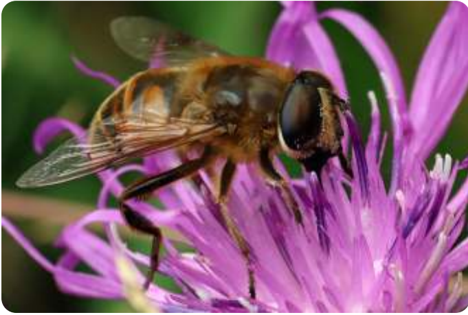
Blinde bij