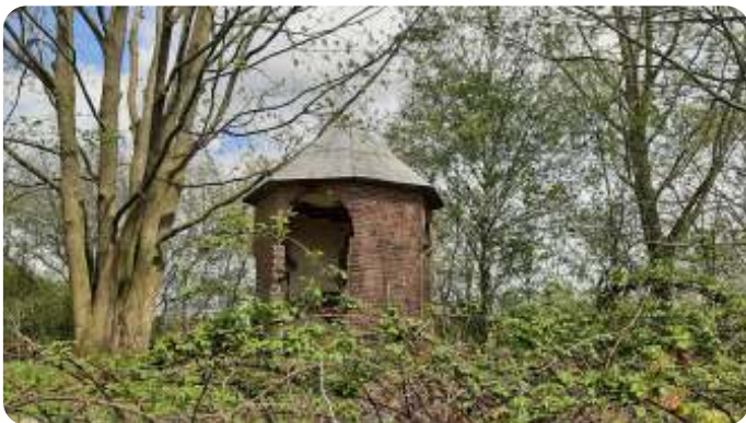
Het Koepeltje

-Een natuurwaarden onderzoek kost veel geld. Daarna kan je ontheffing vragen.