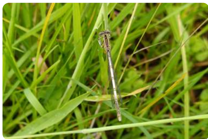
Blauwe breedscheenjuffer