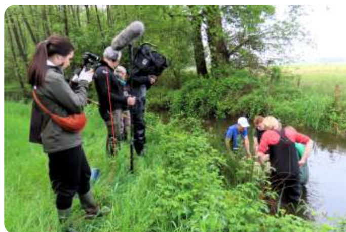
Film- en fotocameraploeg op de oever

Voor ons als werkgroep superleuk om zo'n opname eens mee te maken en een kijkje te nemen achter de schermen. Wat er allemaal al niet komt kijken voor een opname van een uitzending van een paar minuten! Wij zijn samen flink bezig geweest met opnames en daarna dus met z'n allen nog even koffie, thee en napraten. De opnamecrew gaat door naar de Peedijk voor het tweede deel van deze opname dag, over haften. Wij gaan om 11.00 uur terug naar D'n Aard. Nog even spannend of we uit de modderpoel op de weg kunnen komen. Normaal staan we er hoogstens met 2 auto's en nu waren er zeven, waarvan wij en Iris als laatsten teruggaan. Maar dat is gelukt.