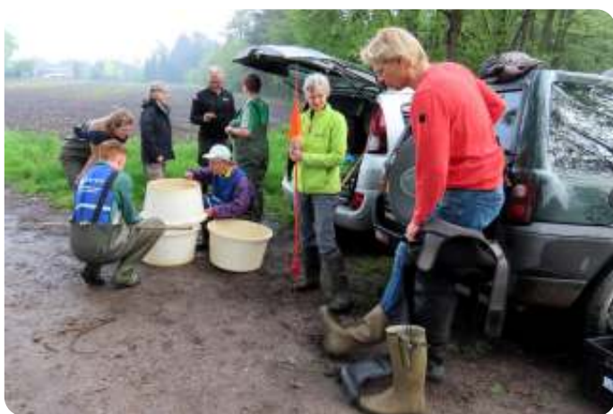
De spullen worden verzameld en de waadbrokken aangedaan.