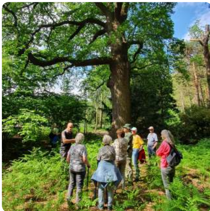
Eeuwenoude Eik