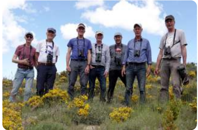
De groep

Na een goede nachtrust struinen we de omgeving wat verder af. Door houtwalrijk agrarisch land maken we weinig kilometers in uren tijd, er is zoveel te zien en te horen! De eerste orpheusspotvogel van de vakantie is een goede test voor de geluidjesherkenners met zijn gevarieerde zang, gelukkig laat hij zich af en toe goed zien zodat de determinatie zeker is. In de lucht zien we de eerste wespendieven en rode en zwarte wouwen gebruik maken van de thermiek. In het struweel zingen ook nachtegalen en ontwaren we een grauwe klauwier , over de akkers scharrelen grauwe gorzen en zien we de zangvlucht van