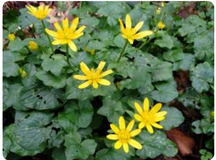
Gewoon speenkruid