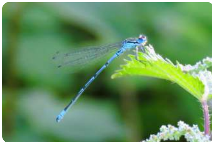
Azuurwaterjuffer in het Dommeldal