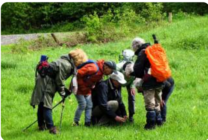
Wat zien we?

Uiteindelijk wandel je over de voormalige bodem van de