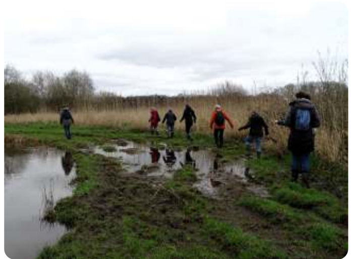
Er was veel water.... buiten de Kleine Beerze