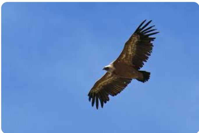
Vale gier