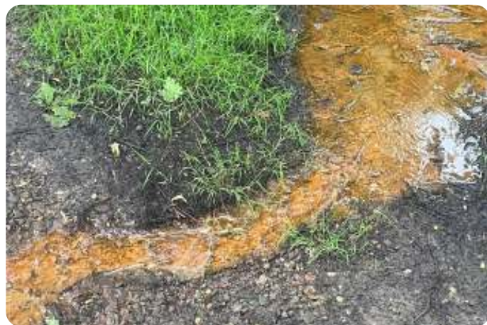
Spontane beeklopen