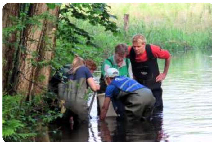
Spannend of er iets gevangen is

Voor deze aflevering zijn vier locaties bij de Dommel bezocht. Bij één ervan was onze waterwerkgroep dus nauw betrokken.