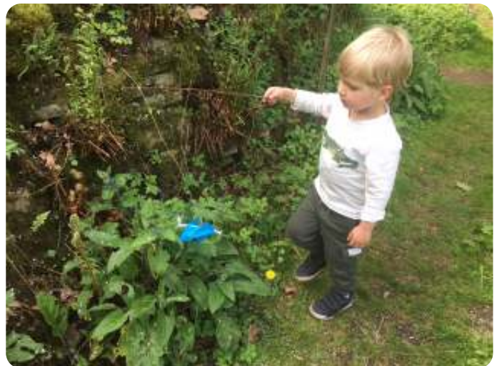
Vlinders maken

De vlindertafel leek toch wel favoriet. Hier zie je de mooie vlinder die van alle bloemetjes onderweg lekker kon snoepen.