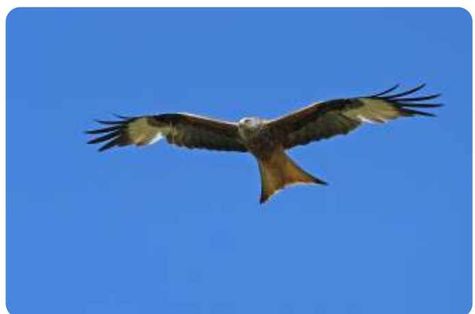
Rode wouw