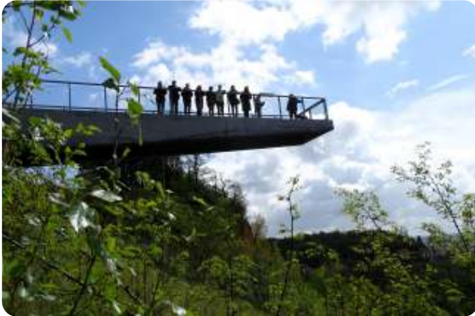
Uitzichtpunt over de voormalige ENCI-groeve

Dit jaar ging de jaarlijkse daguitstap van de plantenwerkgroep op 17 april naar de Sint Pietersberg. Met z'n negenen arriveerden we rond 10.15u op de berg, waar we meteen al een prachtig uitzicht hadden op fort Sint Pieter. Het is een uit baksteen en mergelblokken opgetrokken fort, dat in 1702 werd gebouwd ter verdediging van de stad Maastricht. Maar eerst is er koffie met Limburgse vlaai.