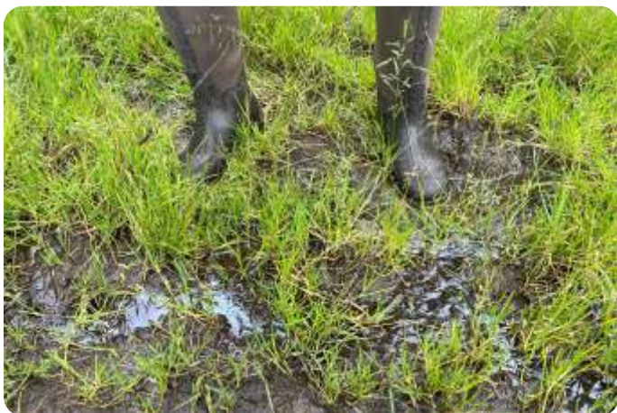
In de modder....