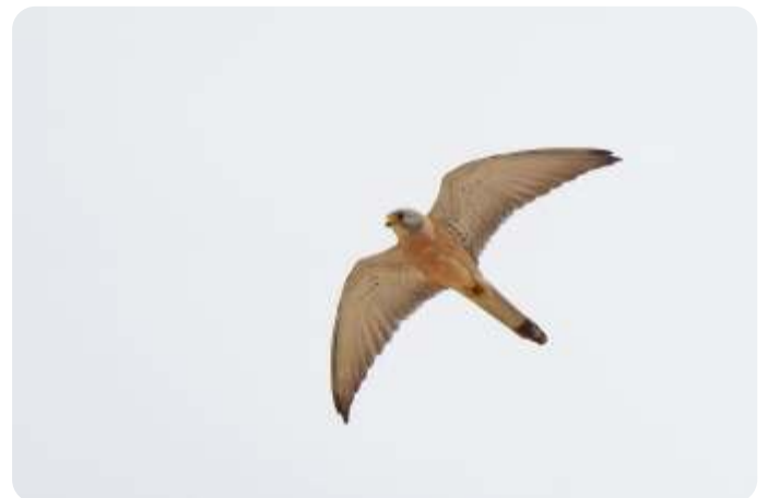
Kleine torenvalk

Op andere momenten in de vakantie zit het even wat tegen als de agrarische subsidies het lijken te hebben gewonnen van het behoud aan biodiversiteit, of wanneer het pad dat we moeten nemen om de rotskruiper te vinden zelf onvindbaar blijkt. Maar daarvoor in de plaats is er altijd de prachtige omgeving met haar eigen flora en fauna en de sfeer in de groep blijft onverminderd goed. Op veruit de meeste locaties hebben we heerlijk kunnen genieten; van de 8 kleine torenvalken die om de kerktoren van Valfarta cirkelen, of de sub-adulte steenarend die vlakbij ons opsteeg en nieuwsgierig boven ons kwam cirkelen, of toen bleek dat de roodkopklauwier en grauwe klauwier tóch in hetzelfde beekdal zaten, na een juiste determinatie van de theklaleuwerik (dat doen we immers ook niet iedere dag) of toen de westelijke baardgrasmus eindelijk eens vrijuit bovenin een boompje ging zitten zingen.