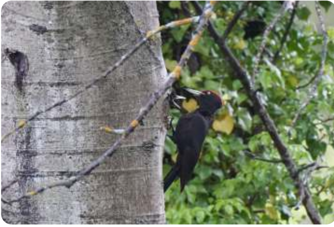
Zwarte specht bij nest