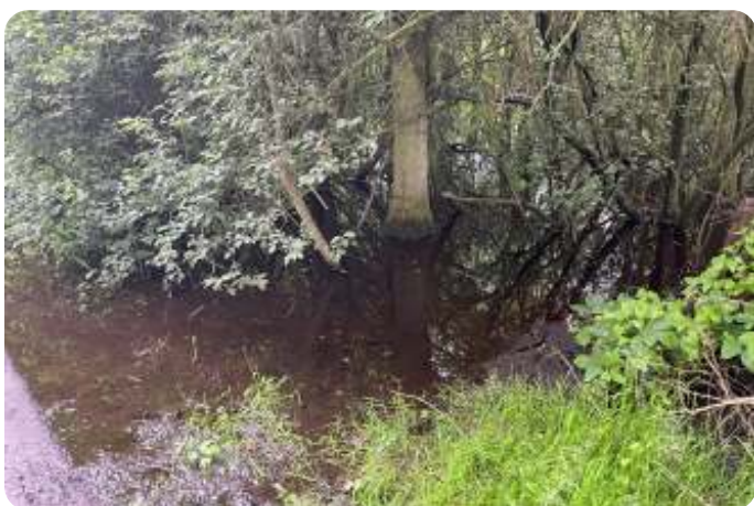
Langs het fietspad